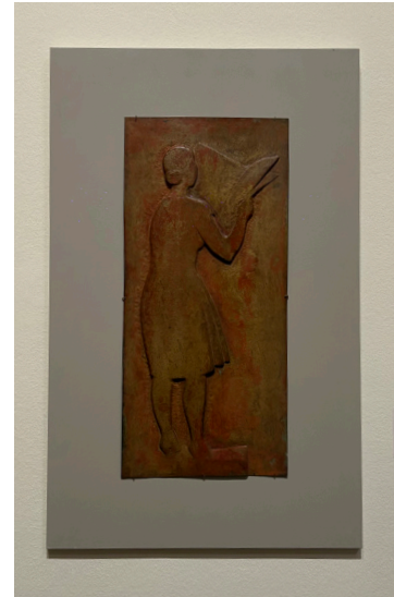
Títol: Mujer joven con periódico.