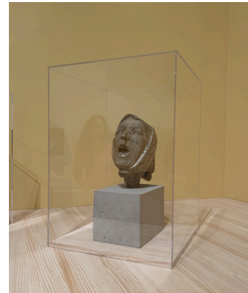
Títol: Cabeza de Montserrat

Les dones estan transformades en cactus per a protegir-se.