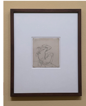
Títol: Joven sentada peinándose

Sembla que l'escultor dibuixi en l'espai.