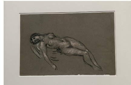
Títol: Desnudo tumbado cabeza inclinada.