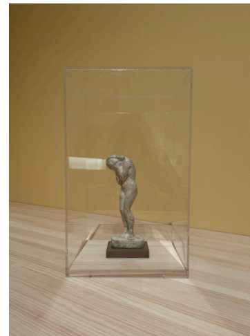
Títol: Desnudo de pie melancólico .

Es deia que la dona pecadora era culpable de fer una cosa incorrecta.