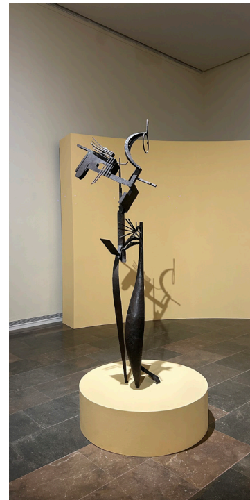
Títol: Mujer ante el espejo