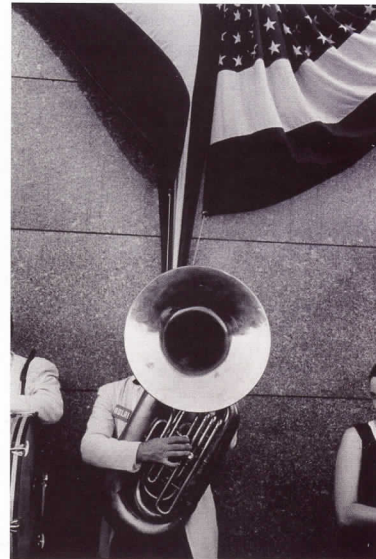
ROBERT FRANK Political Rally (Mitin político), Chicago, 1955-56