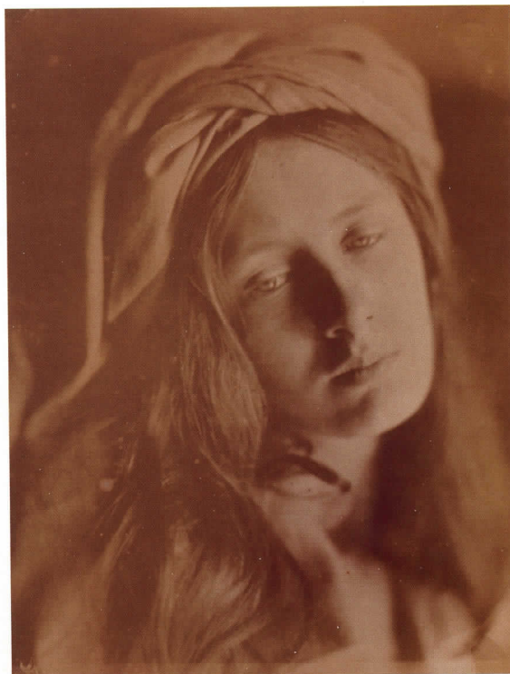
JULIA MARGARET CAMERON Beatrice, 1870

Debido a las escasas colecciones fotográficas que existían en España en el inicio de las colecciones del IVAM y gracias a la colección de la Real Academia de Bellas Artes de San Carlos, que fue depositada en el IVAM y que cuenta con piezas históricas de alguno de los grandes pioneros en la utilización de la escritura de la luz, se decidió alargar el periodo de actuación de la Colección