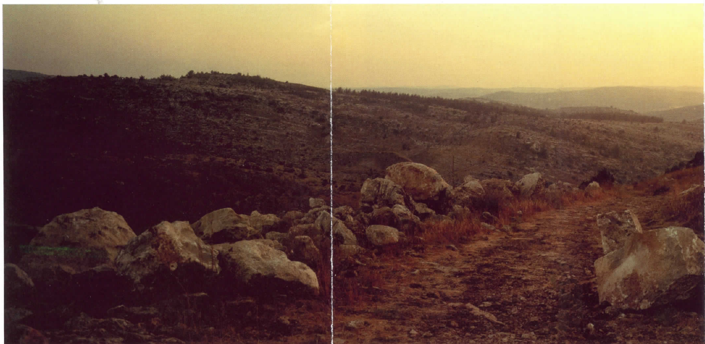
WIM WENDERS The road to Emmaus, near Jerusalem (El camino a Emaús, cerca de Jerusalén), 2000

Sin restricción por las técnicas utilizadas, podemos ver en esta exposición, las posibilidades que ofrece el fotomontaje en todas sus vertientes. Desde las primeras utilidades por los primeros fotógrafos que intentaban simular una acción realista, a las diferentes experimentaciones que se originaron en la época de la Vanguardias