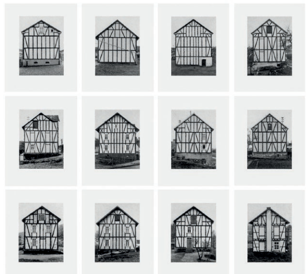
Bernd i Hilla Becher, Fachwerkbäuser, Siegener Industriegebiet , 1993. IVAM Institut Valencià d'Art Modern, Generalitat. Dipòsit Cal Cego. Col·lecció d'Art Contemporani

apropiat d'altres contextos com el cinema o la publicitat; com a representació d'una escena preparada davant de la càmera; com a una composició de múltiples registres fotogràfics; com a imatge manipulada en fotomuntatge o com a imatge directa de la realitat. En tots aquests casos, la fotografia no necessita atorgar-se cap valor estètic propi perquè la seua