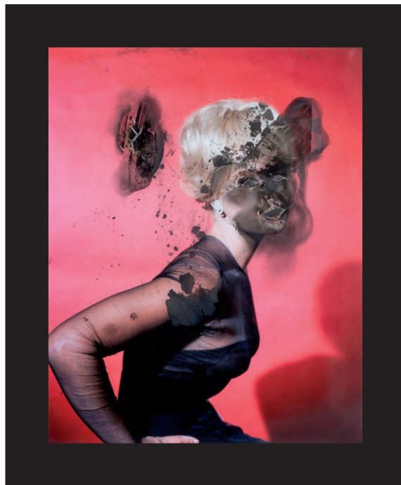
Douglas Gordon, Self portrait of you+me ( Elke Sommer ), 2006. IVAM Institut Valencià d'Art Modern, Generalitat. Dipòsit Cal Cego. Col·lecció d'Art Contemporani

Dossier de premsa Institut Valencià d'Art Modern