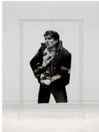
Darío Villalba, Hombre , 1974. IVAM Institut Valencià d'Art Modern, Generalitat

Obres de l'art pop, l'art conceptual, el post-modernisme, l'art corporal, la performance, la fotografia escenificada, la nova objectivitat fotogràfica de finals del segle XX, la revisió del documentalisme o el recurs més recent de la imatge digital, componen la varietat de referències artístiques recollides en aquesta mostra.