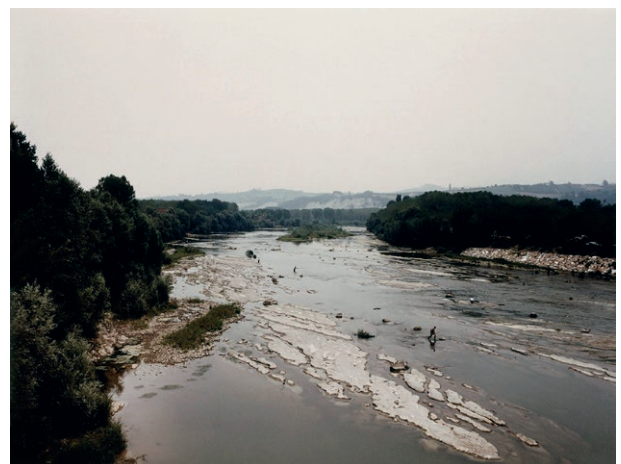
Andreas Gursky, Alba, 1989 . Colección Telefónica. En dipòsit a l'IVAM Institut Valencià d'Art Modern, Generalitat