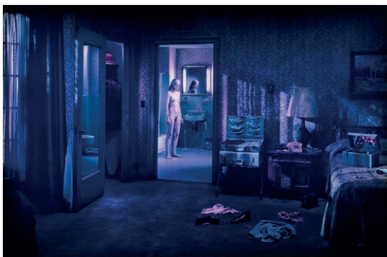
Gregory Crewdson, Untitled (blue period) , 2004. IVAM Institut Valencià d'Art Modern, Generalitat. Dipòsit Cal Cego. Col·lecció d'Art Contemporani