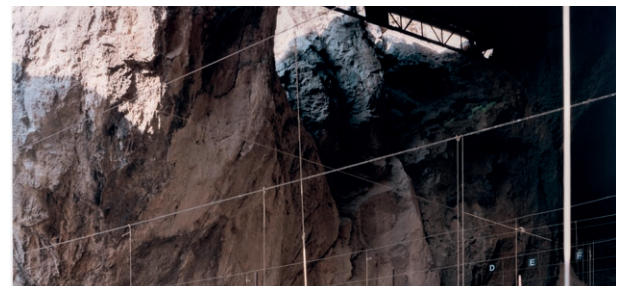
Bleda y Rosa, Hombre de Tautavel . Cueva del Arago, 2003. IVAM Institut Valencià d'Art Modern, Generalitat. Dipòsit Cal Cego. Col·lecció d'Art Contemporani