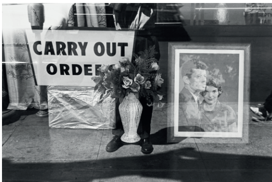
Lee Friedlander, Washington, D.C. , 1962. IVAM Institut Valencià d'Art Modern, Generalitat. Donació Zabriskie Gallery i Lee Friedlander, New York