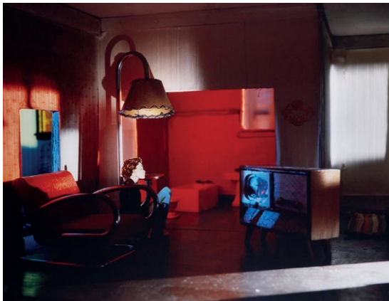
Laurie Simmons, The Long House (TV Room) , 2004. IVAM Institut Valencià d'Art Modern, Generalitat