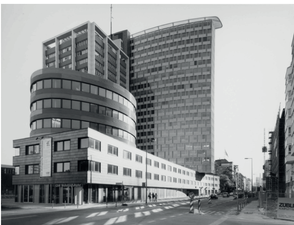
Gabriele Basilico, Berlin, 2000 . IVAM Institut Valencià d'Art Modern, Generalitat. Donació D. Gabriele Basilico

A través de les nocions de petjada, narrativa i concepte la mostra recull eixa heterogeneïtat del fotogràfic en relació amb l'art. En primer lloc, com a petjada, la fotografia és una inscripció material de la realitat capaç de generar un vincle tangible amb el món i amb els altres. En segon lloc, com a narrativa i com a revers d'aquesta petjada del món real, la fotografia posseeix la qualitat de representar el món per analogia per a revelar-lo o documentar-lo, però també per a relatar-lo i, a vegades, per a inventar-lo. I, finalment, com a concepte,