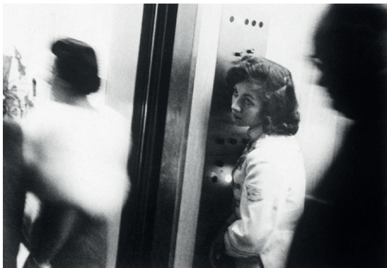
Robert Frank, Elevator - Miami Beach , ca. 1955-1956. IVAM Institut Valencià d'Art Modern, Generalitat

La definició de la fotografia com «al mig» posa en relleu l'ús de la imatge fotogràfica que ha tingut lloc en l'art d'aquest període a través de diferents procediments: com a recurs visual