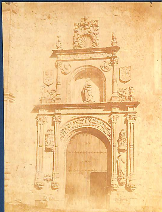
Charles Clifford. S. T. 1853.

Analitzant el contingut global d'aquesta col·lecció fotogràfica, es comprova que la seua importància no depén tan sols del valor documental que presenta, ni de la comprovació visual dels primers procediments fotogràfics, sinó també i simplement pel gran valor estètic que demostren, aportant així la primera baula de la Col·lecció Històrica de l'IVAM.