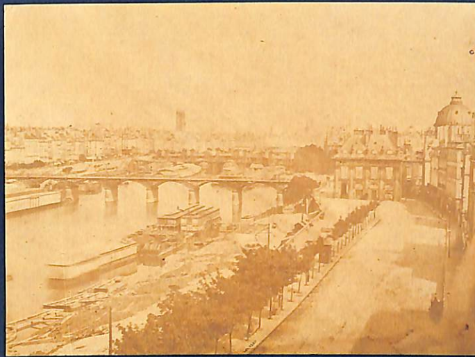
Hippolyte Bayard. París . 1850.

La col·lecció es divideix en dos grans grups, segons el motiu fotografiat: imatges sobre obres d'art i paisatges, algunes d'aquestes realitzades per autors anònims i, també, per W. Henry Fox Talbot, Hippolyte Bayard, J. Laurent, Charles Clifford i Blanquart-Evrard, pioners i grans aportadors en l'art fotogràfic.