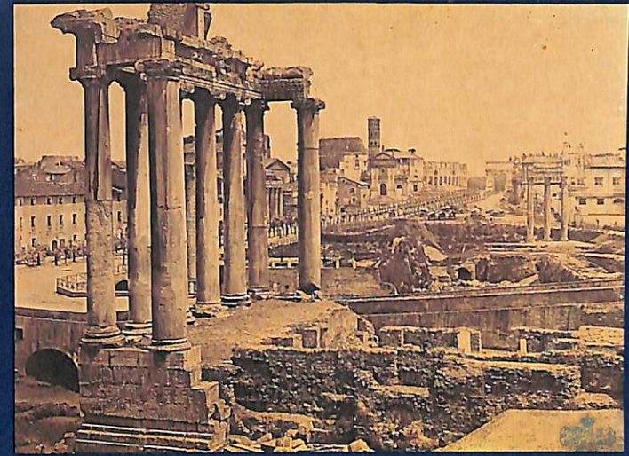
Anònima. Roma. Fòrum Romà . S. F.

Louis-Désiré Blanquart-Evrard va seguir amb la pràctica del procediment de Talbot, encara que millorant-lo mitjançant la humidificació del negatiu que col·locava entre dos vidres i escurçant el temps d'exposició. Investigador del paper albuminat, va fundar el primer taller dedicat a la publicació d'àlbums amb fotografies enganxades. Les dues obres que es presenten pertanyen a l' Album photographique de l'artiste et l'amateur publié sous la direction de M. Blanquart-Evrard , publicat el 1851.