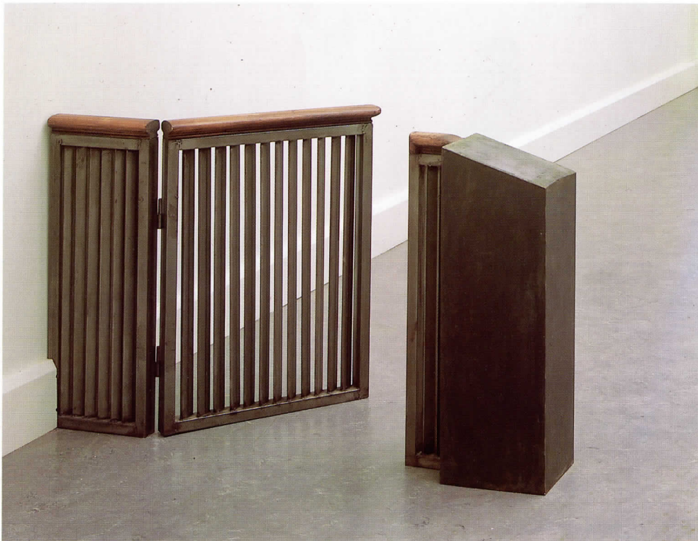
De la identidad, 1987

La reflexió sobre l'espai on es desenvolupa l'existència de l'home ocupa un lloc central en l'obra de Juan Muñoz (Madrid 1953); les seues escultures, mai concebudes com a instal·lacions, proposen uns llocs per a recórrer amb la mirada, la veu i la memòria. Al mateix temps en constitueixen un decorat fix, com en el teatre clàssic, amb uns punts de vista variables.