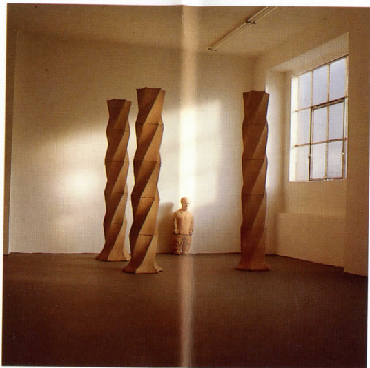
Enano con tres columnas, 1988