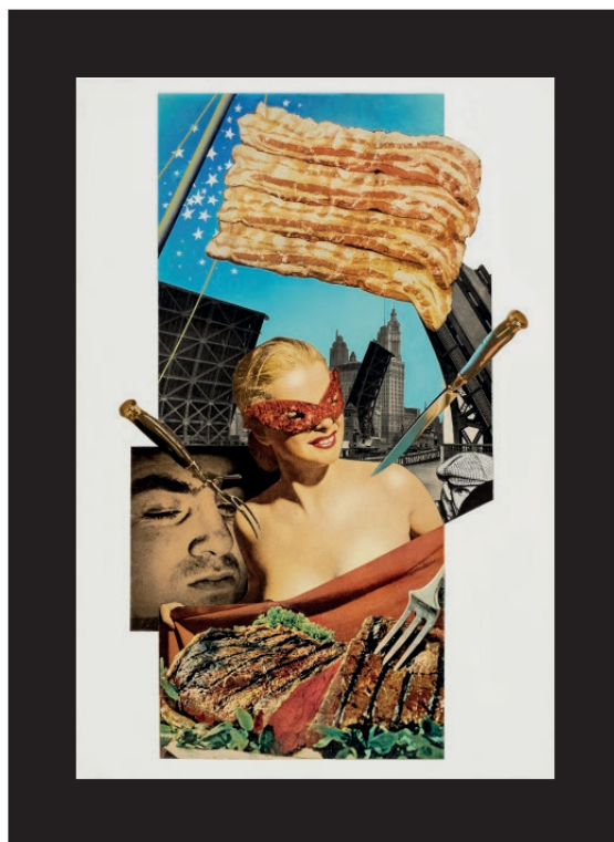
Chicago's Miss Beefsteak , de la serie The American Way of Life , ca. 1960-1966. IVAM Institut Valencià d'Art Modern, Generalitat. Depòsit Fundació Josep Renau, València