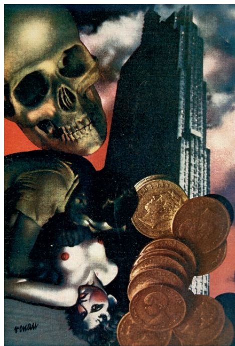
Siglo XX. Amor financiero, 1936. IVAM Institut Valencià d'Art Modern, Generalitat. epósito Fundació Josep Renau, Valencia

Afiliado al Partido Comunista de España en 1931, e influenciado tempranamente por los fotomontajes realizados por Heartfield para las revistas VI y AIZ , Renau abandonará muy pronto la práctica de la pintura de caballete para abordar la realización de una obra