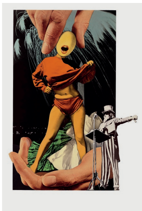
Ob..., yes..., I like to be a sexy thing...! , de la serie The American Way of Life , 1957. IVAM Institut Valencià d'Art Modern, Generalitat. Depòsit Fundació Josep Renau, València

Durante estos frustrantes años de exilio en México y en un contexto de recrudescimiento de la Guerra Fría, Renau comenzará a desarrollar la serie de fotomontajes The American Way of Life , sin duda su corpus de obra más brillante y personal, a la que dedicará más de veinte años de su vida. La disección de las contradicciones del capitalismo americano será la trama argumental que regirá la realización de estos 69 fotomontajes. Estructurados como una suerte de relato filmado, el artista expone en esta serie sus furibundas críticas contra el racismo americano, la marginación social, el belicismo de la nación, los grandes monopolios empresariales,