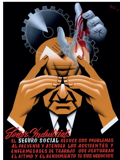
Señor industrial. El seguro social reduce sus problemas, 1947.

Durante su exilio en México, el prestigio adquirido por Renau como cartelista durante su etapa republicana le abrirá las puertas de la industria en su país de acogida. Eran los tiempos en que el cine mexicano vivía el máximo esplendor de su industria y de sus estrellas nacionales, como Jorge Negrete, María Félix, Cantinflas, etc. La producción de carteles de cine de Renau se multiplicó en México. En