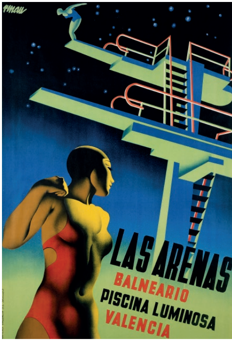
Las Arenas. Balneario. Piscina luminosa, Valencia, 1932. IVAM Institut Valencià d'Art Modern, Generalitat. Depòsit Fundació Josep Renau, Valencia

muralista, teórico, agitador y héroe militar de la revolución mexicana —a quien Renau había conocido en Valencia en 1937— le invitó a participar en la realización de un mural colectivo para la nueva sede social del Sindicato Mexicano de Electricistas (SME), un hito de la arquitectura funcionalista.