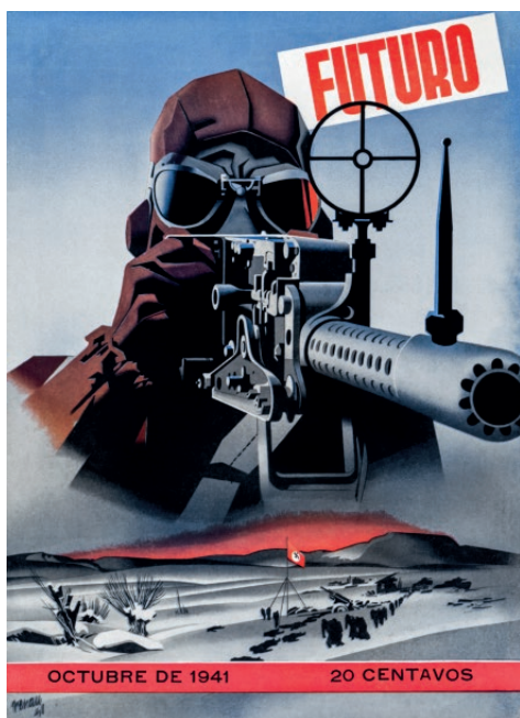
Portada de la revista Futuro , 1941. Biblioteca i Centre de Documentació IVAM. Depòsit Fundació Josep Renau, València