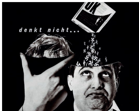
“Denk nicht...” (No pienses...), de la serie Über Deutschland (Sobre Alemania), 1966 IVAM Institut Valencià d'Art Modern, Generalitat. Depòsit Fundació Josep Renau, Valencia

En 1966 Renau se embarcó en la realización de 24 fotomontajes en blanco y negro bajo