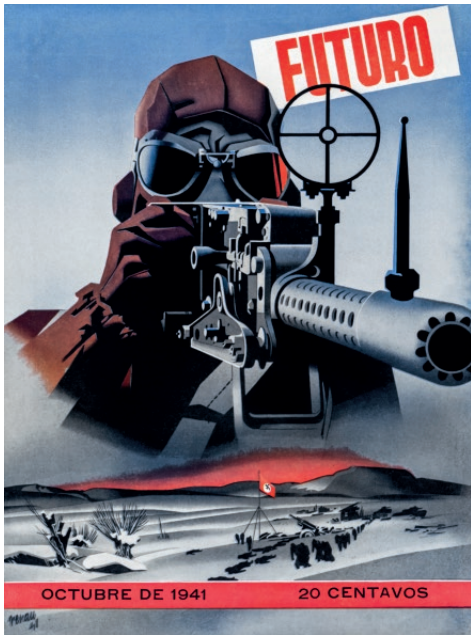
Portada de la revista Futuro, 1941.