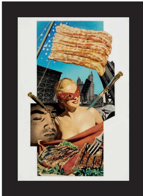
Chicago's Miss Beefsteak , de la sèrie The American Way of Life , ca. 1960-1966. IVAM Institut Valencià d'Art Modern, Generalitat. Depòsit Fundació Josep Renau, València