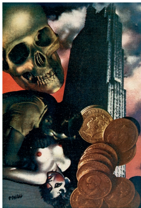
Siglo XX. Amor financiero, 1936. IVAM Institut Valencià d'Art Modern, Generalitat. epósito Fundació Josep Renau, València

Afiliat al Partit Comunista d'Espanya en 1931, i influenciat primerencament pels fotomuntatges realitzats per Heartfield per a les revistes VI i AIZ , Renau abandonarà molt prompte la pràctica de la pintura de cavallet per a abordar la realització d'una obra innovadora,