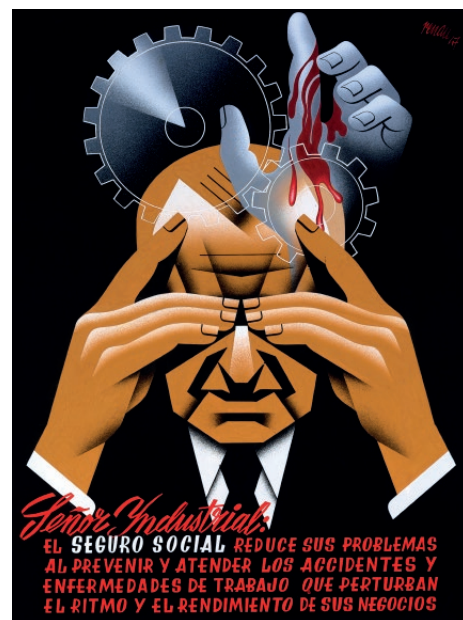
Señor industrial. El seguro social reduce sus problemas, 1947. IVAM Institut Valencià d'Art Modern, Generalitat. Depòsit Fundació Josep Renau, València

Durant el seu exili a Mèxic, el prestigi adquirit per Renau com a cartellista durant la seua etapa republicana, li obrirà les portes de la indústria al seu país d'acolliment. Eren els temps en què el cinema mexicà vivia la màxima esplendor de la seua indústria i de les seues estrelles nacionals, com Jorge Negrete, María Félix, Cantinflas, etc. La producció de cartells de cinema de Renau es va multiplicar a Mèxic.