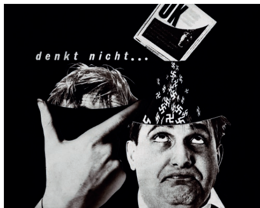
“Denk nicht...” (No pensis...), de la sèrie Über Deutschland (Sobre Alemanya), 1966 IVAM Institut Valencià d'Art Modern, Generalitat. Depòsit Fundació Josep Renau, València

sota el títol Über Deutschland (Sobre Alemanya). Concebut per a ser filmats com la seqüència d'un telefilm, en esta obra Renau atacarà la política de rearmament i el ressorgir del nazisme a l'Alemanya capitalista. D'una manera satírica, este conjunt de fotomuntatges narra la historia de Michel, un alemany occidental de tipus mitjà amb escassa formació i nul criteri polític, un homenet mediocre convertit en presa fàcil de la manipulació dels polítics sense escrúpols.