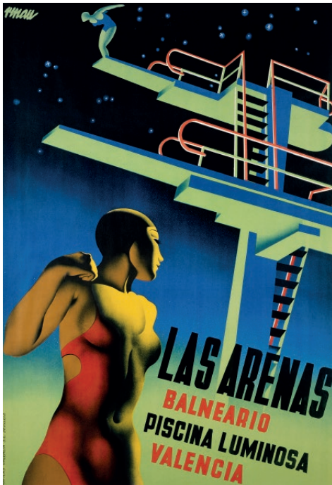
Las Arenas. Balneario. Piscina luminosa, València, 1932. IVAM Institut Valencià d'Art Modern, Generalitat. Depòsit Fundació Josep Renau, València

Siqueiros, prestigiós muralista, teòric, agitador i heroi militar de la revolució mexicana —a qui Renau havia conegut a València en 1937— li va convidar a participar en la realització d'un mural col·lectiu per a la nova seu social del Sindicat Mexicà d'Electricistes (SME), una fita de l'arquitectura funcionalista.