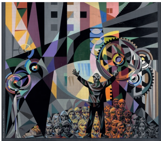
El dominio de la naturaleza por el hombre , 1969 IVAM Institut Valencià d'Art Modern, Generalitat. Depòsit Fundació Josep Renau, València

En 1966 Renau es va embarcar en la realització de 24 fotomuntatges en blanc i negre