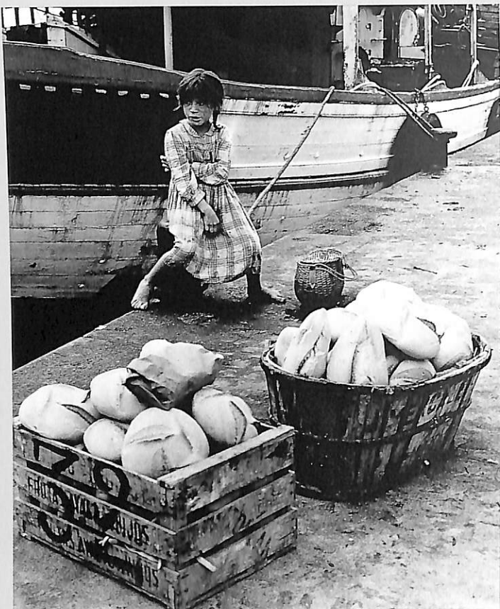
El pan nuestro, 1963

El mes de juny AFOCO de Còrdova realitzà una exposició com a homenatge pòstum al fotògraf. Pel novembre del mateix any l'Agrupació fotogràfica Valenciana dedicà, dins del programa València Imatge 88, una exposició col·lectiva a J. Miguel de Miguel que es va presentar al Centre Cultural de la Caixa d'Estalvis de València.