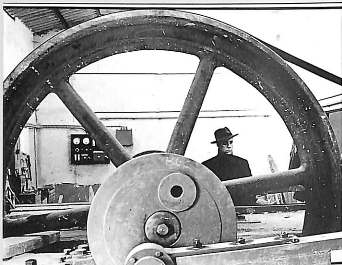
La Industria. 1966