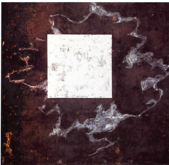
Flor Linea blanca , 1987.