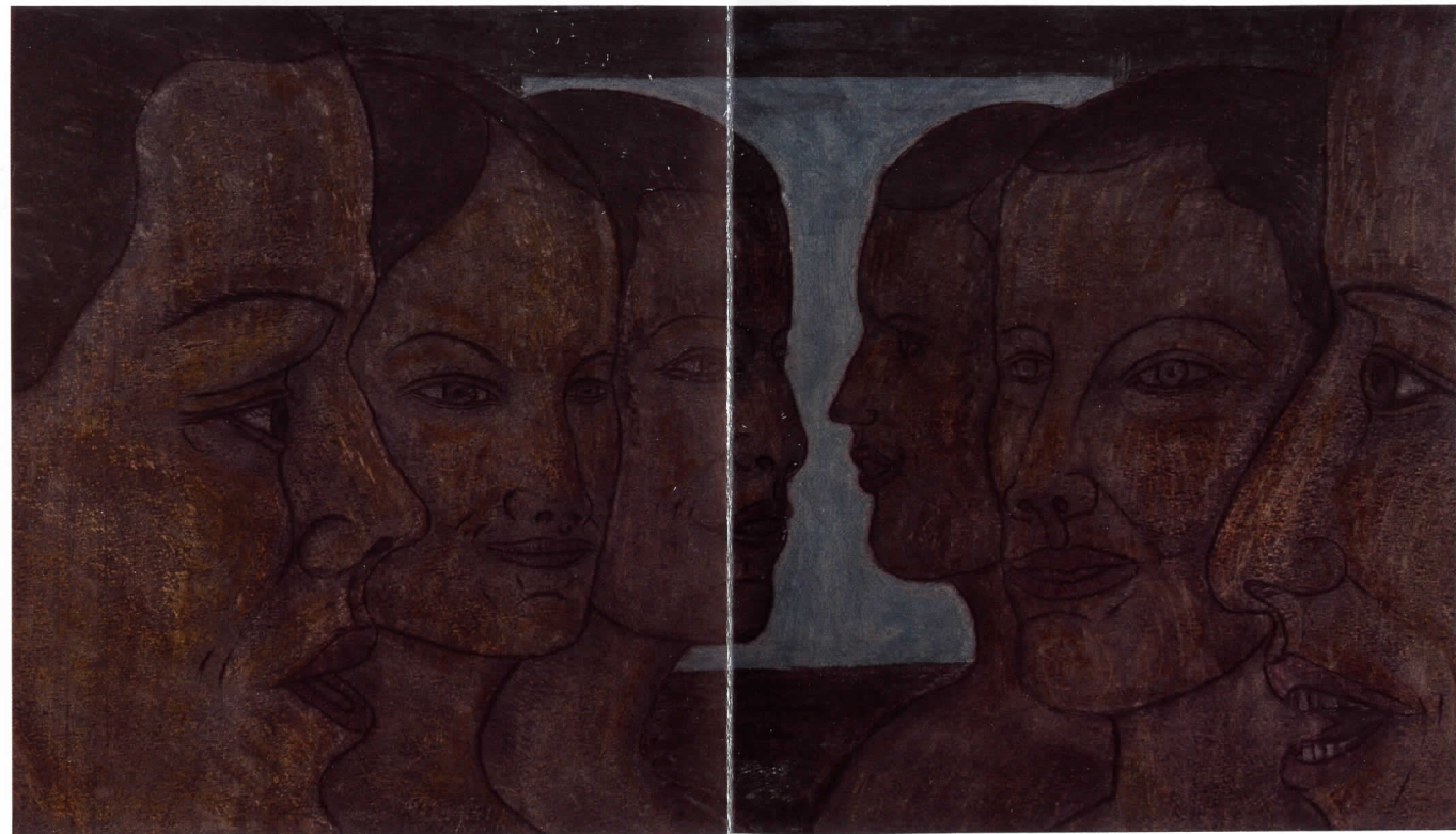
Journey (Night Train) (Viaje [Tren de nit]), 1993-94