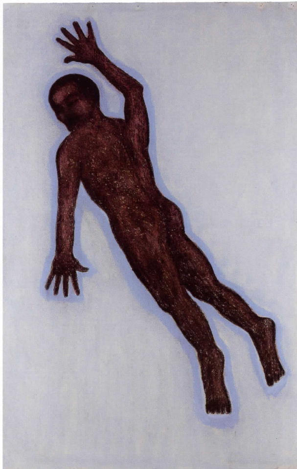
Swimmer (Nadador), 1994

L'artista John Davies (Cheshire 1946) és conegut per ser un dels màxims exponents de l'escultura britànica actual. L'àmplia retrospectiva dedicada per primera vegada al nostre país a la seua obra, la qual es podrà veure al Museo de Bellas Artes de Bilbao i a l'IVAM de València, ha permès que el públic espanyol pugua descobrir la gran fascinació que exercix el seu discurs plàstic figuratiu.