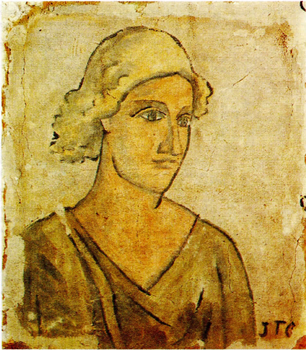
Cabeza clásica, 1942