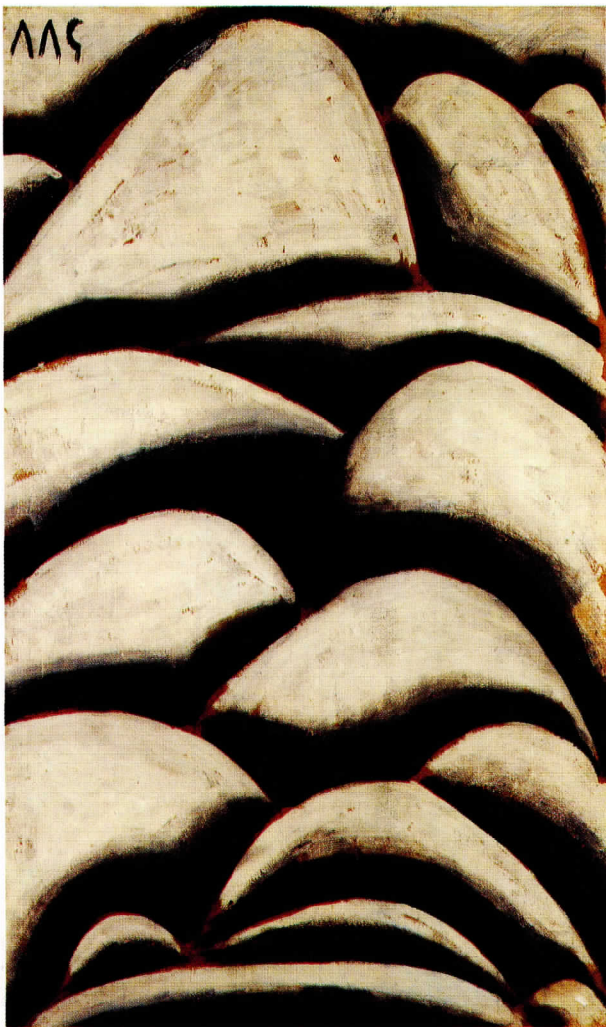
Ritmos curvos en blanco y negro, 1937