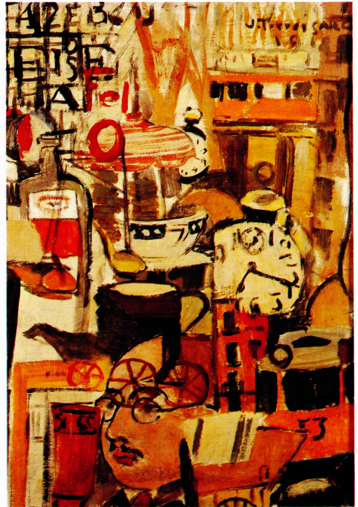
Composició vibracionista, 1918

Durant la primera dècada del segle XX Torres-García s'orienta cap a una pintura d'inspiració neoclàssica que, finalment, cristal·litzarà en el moviment que Eugeni d'Ors anomenarà Noucentisme. Juntament amb l'escultor Clarà i el pintor Joaquim Sunyer, Torres-García és l'artista més destacat d'aquest moviment; entre 1912 i 1918 es dedica a allò que serà la seua obra més repre-