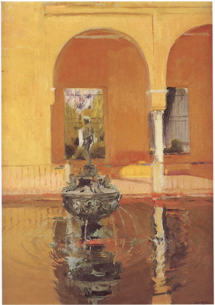
Fuente del Alcázar de Sevilla, 1908.

Pintat uns anys després de La vuelta de la pesca (1894) i uns anys abans que Sol de la tarde (1903), aquest quadre sembla marcar el final d'una etapa i l'inici d'una altra que l'autor desenvoluparà a partir d'aquesta obra.