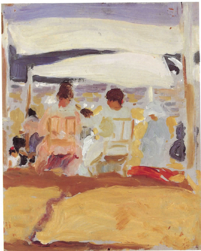
Bajo los toldos (San Sebastián), 1912

El contracte signat entre Sorolla i Archer M. Huntington a París el 26 de novembre de 1911, en virtut del qual Sorolla es comprometia a pintar per a la Hispanic Society of America una sèrie de panys de paret a l'oli que representassen aspectes de la vida espanyola, d'uns tres o tres metres i mig d'alçada per setanta de llarg, havia de constituir la preocupació dominant de la vida de Sorolla fins que, poc després d'acabar el projecte, va patir un atac d'hemiplegia que acabaria amb la seua vida d'artista tres anys abans de la seua mort. A banda dels apunts i d'una sèrie de retrats de personalitats de la vida artística i literària espanyoles, pintats també per encàrrec d'Huntington, Sorolla va passar els anys que van des de 1912 a 1919 treballant sense descans en aquests murals per a la Hispanic Society of America de Nova York.