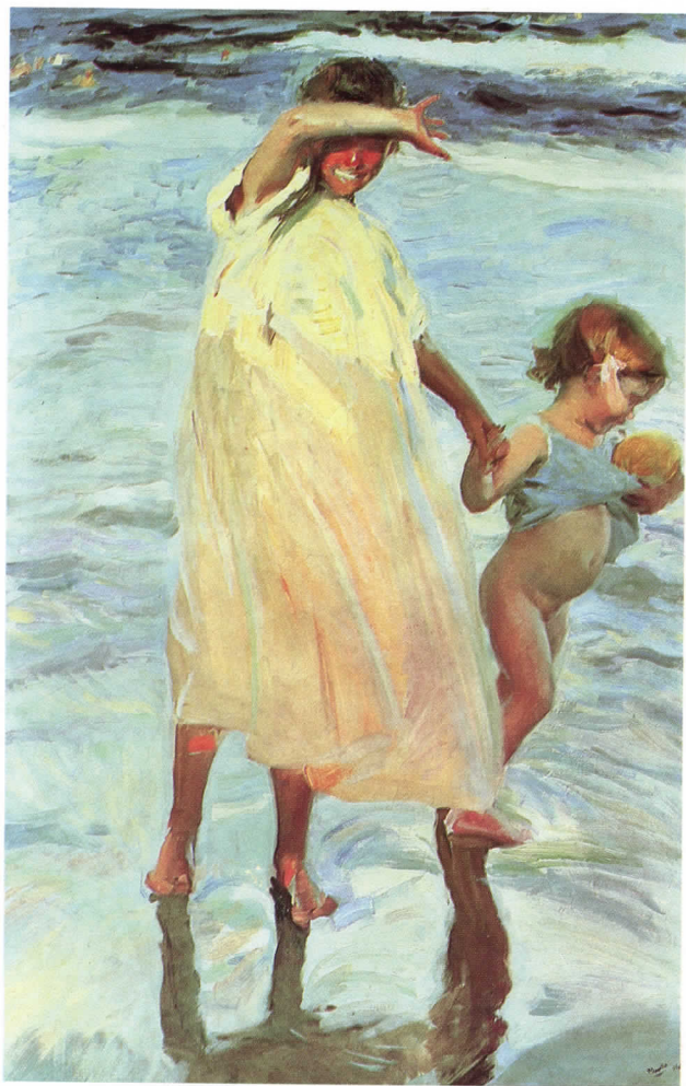
Las dos hermanas , 1909.

De regrés a Roma és acollit per Francisco Padilla, director de l'Acadèmia Espanyola, qui li inculca l'amor per la bellesa de la línia, però també li inicia en el camí cap al "Plein Air". A través del quadre El Entierro de Cristo intenta complaure a l'Acadèmia mitjançant la presentació d'un tema religiós, però quan el va presentar a l'Exposició Nacional de Madrid de 1887 va ser durament criticat per haver pintat no l'enterrament de Crist, sinó l'hora en què l'enterraren.