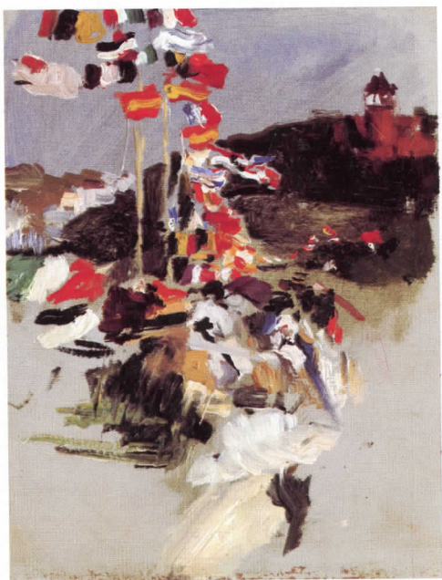
Concurso hípico en Ondarreta, 1912

El novembre de 1907 escriu des del Grau de València després d'una llarga estada a Castella per la convalescència de la seua filla María a La Granja: «Estic ja ací (Grau) des de les quatre de la vesprada, i he gaudit molt amb l'esplèndid espectacle de tanta llum i color. El dia tibi contribueix, no he desaprofitat un moment veient coses boniques: l'aigua era d'un blau tan fi i la vibració de la llum era una follia; he presenciat el regrés de la pesca, les formoses veles, els grups de pescadors, les llums de mil colors reflectir-se en el mar; la conversa picant de molts dels meus vells models em proporcionaren una estona difícil d'oblidar. Són les sis menys quart i he agafat el llapis per a transmetre't aquesta estona de plaer passada en la meua primera vesprada en el port. Ara la nit absoluta és tan agradable com abans, car com jo mai no he viscut en un port l'espectacle em sedueix: les sirenes, el soroll de la càrrega i descàrrega i les llums encara es reflecteixen en el mar... És una llàstima viure a Madrid. ¡Seria tan bonic estar ben instal·lats junt en aquest port i sobretot estar els cinc junts!».