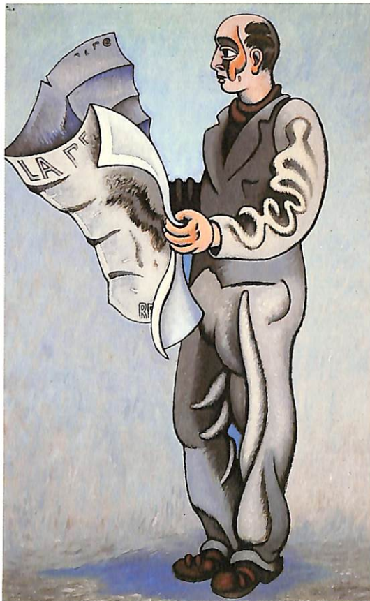
Journalier gris, 1947-48

Hélión torna, cada vegada més, al principi de la recurrència temàtica i l'obra acaba per tancar-se en si mateixa amb un esperit fet a la vegada de gravetat i felicitat, de fantasia i fidelitat als seus principis, la naturalesa i independència del qual el distingeixen com un dels grans mestres del segle xx.