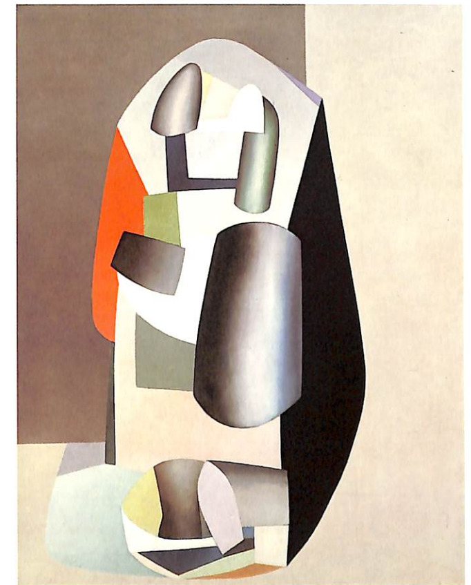
Figure debout, 1936

Fascinat sempre pel món urbà, Hélion serà, des dels esdeveniments de maig del 68 fins al 1987, l'any de la