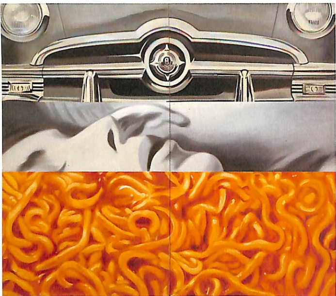
I love you with My Ford, 1961

ments trencats de narració. Crec que ha tractat, com de Kooning, el "melodrama de la vulgaritat", però té raó en considerar que arriba "més enllà" que els expressionistes abstractes amb la seua esbojarrada ferocitat de la seua obra figurativa. Solament deixa entreveure els seus ressentiments en algunes ocasions, com en la mordaç història de la seua reunió amb Reinhardt al Japó. És l'excitant traductor d'efectes urbans amb uns fins pictòrics, i per això ha de ser comparat amb els poetes novaiorquesos Frank O'Hara i Kenneth Koch. I, finalment, és un transcendentalista pel que fa a l'art de la pintura, i exalça el gaudi de "remoure la pintura" i el plaer del treball en l'estudi. Crec que no ha estat considerat com a un surrealista americà, però aquells que presten atenció al seu tractament del detall entreveuran la creació d'un art surrealista americà».