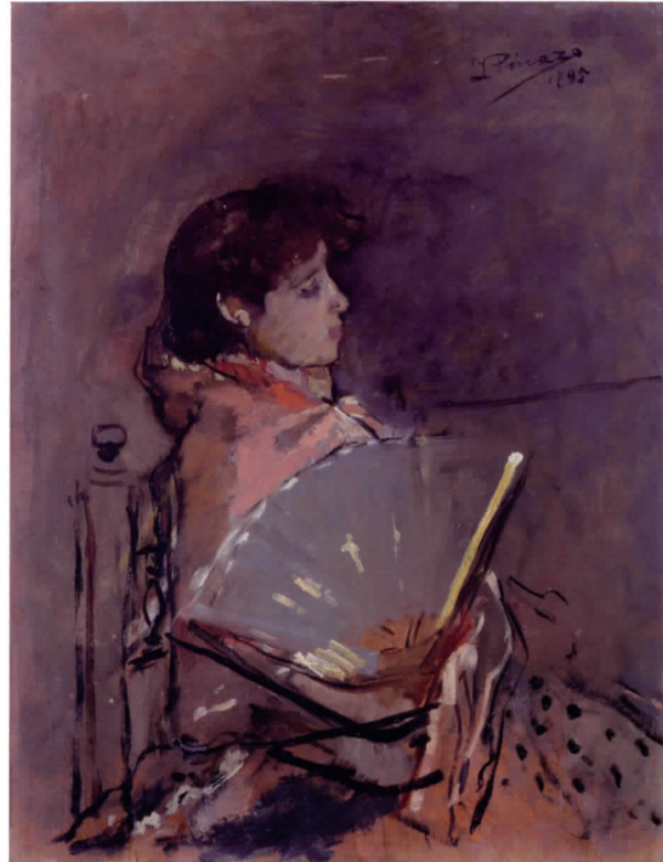
Muchacha con abanico, 1895

la intensidad de su propia creación; que quiera hacer de su pintura algo vivo y palpitante, fuerte y conmovedor, lleno de sentimiento y pasión, pero a la vez delicado, irónico, sencillo, sutil y frágil. Convierte en un fin el propio proceso pictórico, buscando notas y contrastes, sin establecer ningún tipo de escalas ni jerarquías.