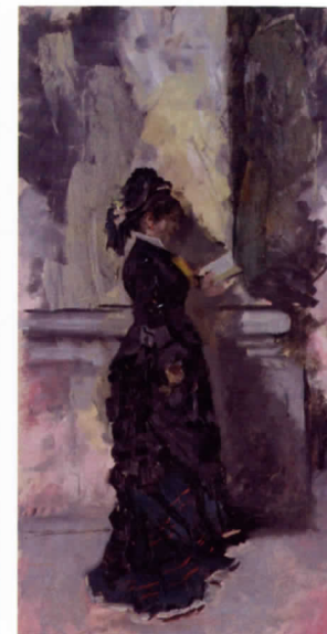
En la Iglesia, s.f.

pintor académico que pudieran hacer pensar sus obras más realistas y acabadas. Pinazo maneja distintos modos de expresión, su creación es bastante polivalente y rica como para constreñirse a una mera definición, acorde con nuestros intereses, que dejase oculta parte de la realidad y complejidad del artista y de su obra. Se puede considerar a Pinazo uno de los pintores españoles más proclives a la experimentación de su tiempo. El análisis y las posibilidades del propio proceso pictórico son los aspectos que él encuentra más inquietantes y fascinantes, algo que le conduce a una especie de frenesí y pasión por la pintura. A través de esta indagación y síntesis de los procesos, Pinazo intuye y se aproxima a muchas cuestiones y evoluciones de la plástica más moderna. Parte de la modernidad de la obra de Pinazo quizá radique también en