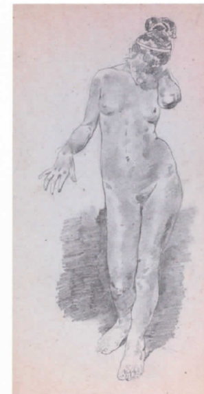
Desnudo femenino, s.f.

La producción de Pinazo es demasiado amplia como para aferrarnos a una sola lectura interpretativa. Ni es exclusivamente el artista vanguardista que a veces se ha querido ver, ni es el