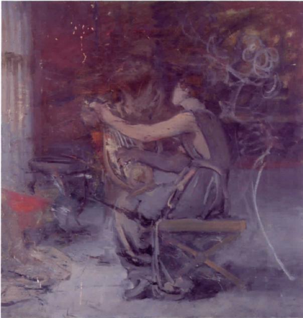
Tañendo la lira, s.f.

la intensidad de su propia creación; que quiera hacer de su pintura algo vivo y palpitante, fuerte y conmovedor, lleno de sentimiento y pasión, pero a la vez delicado, irónico, sencillo, sutil y frágil. Convierte en un fin el propio proceso pictórico, buscando notas y contrastes, sin establecer ningún tipo de escalas ni jerarquías.