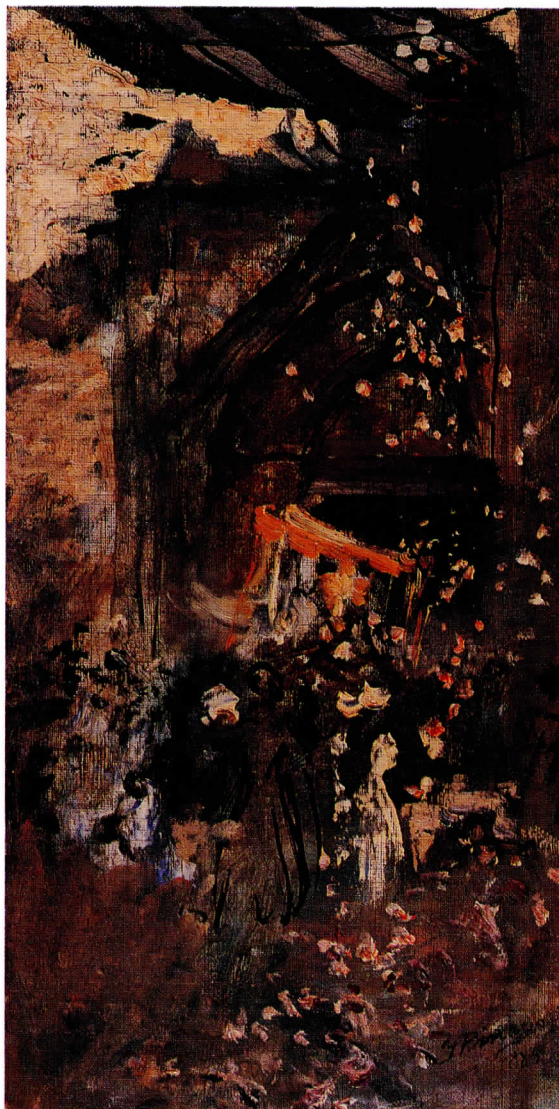
Procesión de Corpus. 1885.