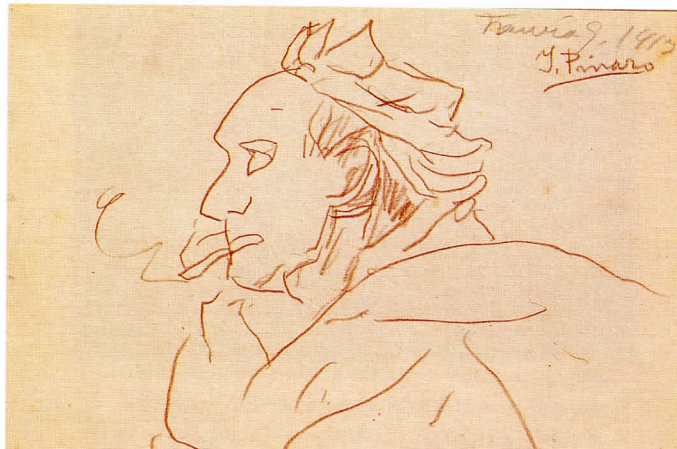
Sin título. 1913.

Per aquell temps el pintor es guanya la vida realitzant retrats de la societat valenciana, a la vegada que desenvolupa una faceta més personal en contacte amb el paisatge i la gent de Godella.