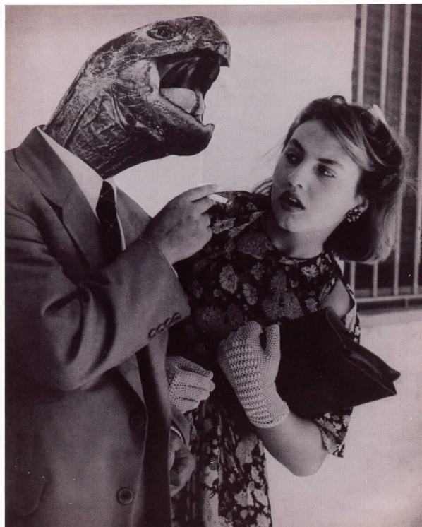
GRETE STERN Sueño nº 28: Amor sin ilusión , Buenos Aires, 1951 Gelatina de plata sobre papel, 50 x 40 cm. Copia de época

Reforzando estas consideraciones previas he creído muy oportuno, a partir de una selección de la Colección del IVAM, plantear la exposición Identidad Femenina para mostrar las obras de mujeres artistas del siglo XX-XXI que han sido el resultado de una vindicación de su identidad. Esta muestra, que ha viajado previamente por varios países de Latinoamérica, ha contado con la colaboración de Acción Cultural Española, AC/E, y con el respaldo de la organización Women Together, vinculada a Naciones Unidas para impulsar los Objetivos del Milenio, y muy en concreto el objetivo que centra su interés en el apartado 'Mujer y Desarrollo.'