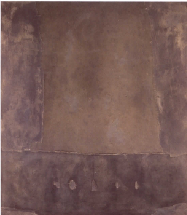
Gris amb cinc perforacions, 1958