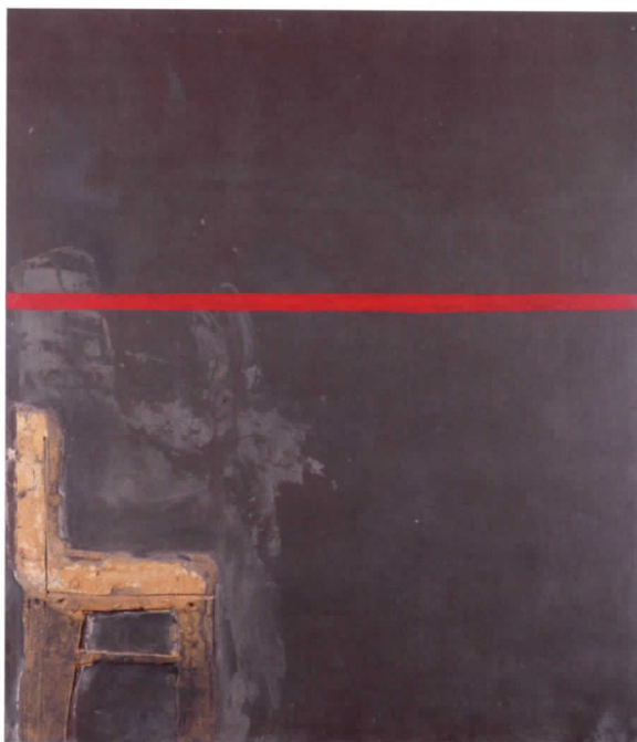
La ligne rouge (Negre amb línia vermella) , 1963

Collage de cabells , 1985. Técnica mixta sobre madera. El artista compone esta obra con una técnica concentrada, una vez más, en objetos reales efímeros para elevarlos a una nueva categoría superior. Con la incorporación de cabello humano a la obra, Tàpies ennoblece las acciones asociadas a la naturaleza humana a la que le dispensó parte de sus investigaciones artísticas.