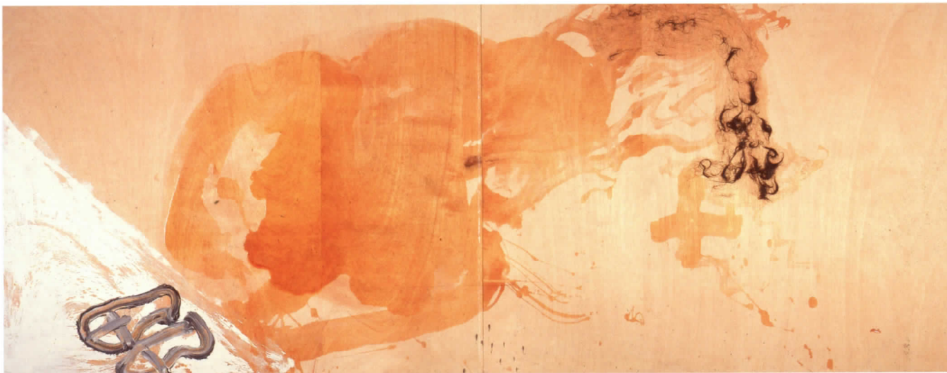
Collage de cabells, 1985

"Nada es mezquino", afirmaba Tàpies parafraseando a Joan Salvat-Papasseit. "Todo tiene su alma, hasta el objeto más sensible, hasta los pucheros y las cacerolas en las que Santa Teresa encontraba a Dios". Con estas reflexiones Tàpies pone de manifiesto una forma de dimensionar el arte que se encuentra en la realidad inmediata, en lo doméstico, en lo cotidiano, en los elementos ordinarios y comunes de un hogar. Pero, a la vez, en esa proximidad a la vida mundana aparece un ascetismo medieval lírico y un misticismo que elevan a categoría espiritual los aspectos y los materiales más íntimos y triviales de esa realidad.