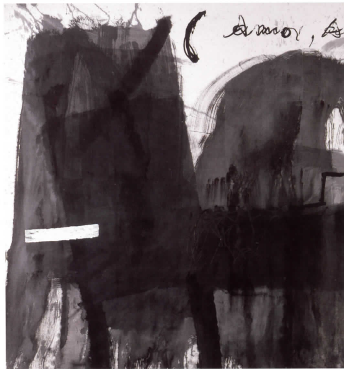
Amor a mort, 1980

Como homenaje a la excelencia y a la inteligencia artística de este insigne artista, el IVAM dedica una exposición para mostrar seis de las obras más relevantes que forman parte de su Colección.