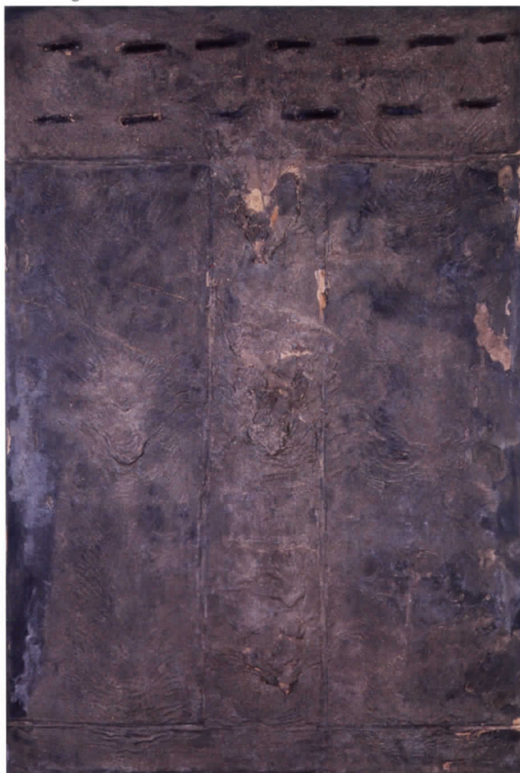
Surface grise rosâtre aux traces noires , 1962