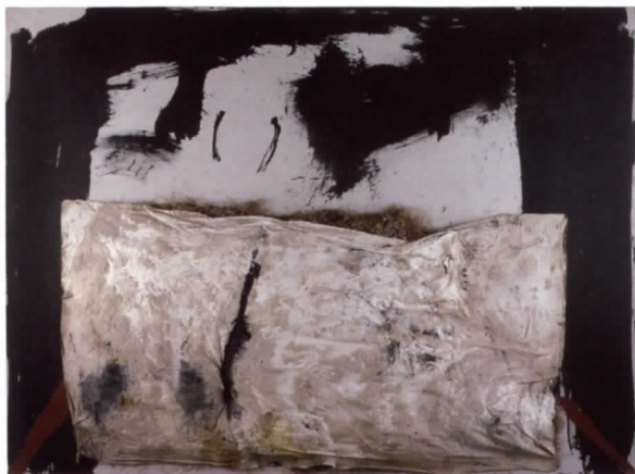
Gran paquet de palla , 1969

Su obra, tal y como se refleja en este "homenaje" basado en las obras más importantes de la Colección del IVAM, está construida para transformar el interior del espectador, en la que el artista se muestra como un alquimista del arte que convierte materia en sueños, minerales en poesía y formas en ideas. Desde esta perspectiva, Tàpies avanza de la nada al todo con el único y expreso deseo de encontrarse con el espectador, para que éste se deleite con unas estructuras que nunca fueron así y nunca hubieran existido