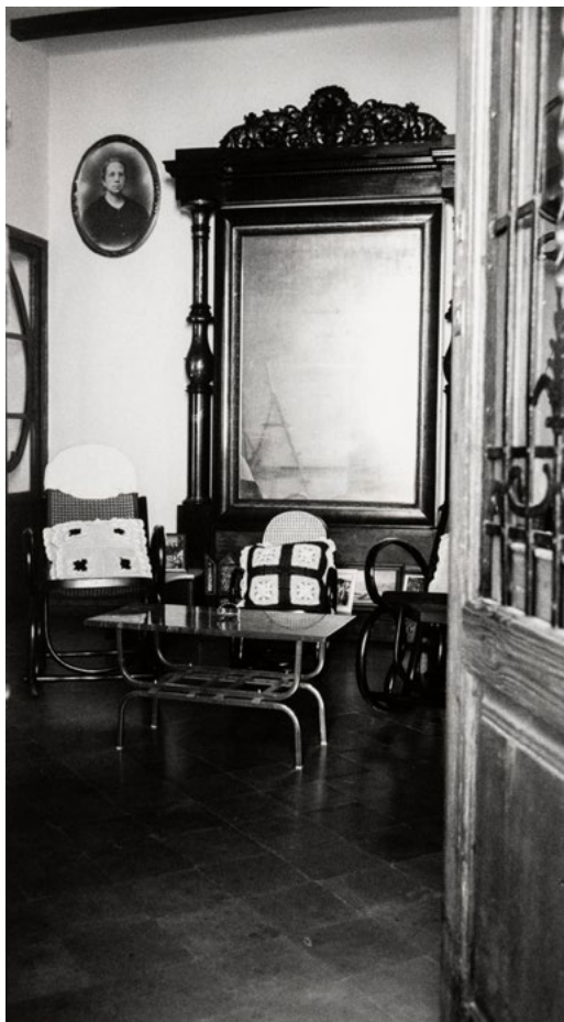
Gabriel Cualladó. Interior de casa de Oliva , de la sèrie/serie Gandia i la Safor, 1990 Interior de casa d'Oliva. Fotografia a les sals de plata sobre paper, còpia d'època 29,4 x 16,5 cm IVAM Institut Valencià d'Art Modern, Generalitat Donació de l'artista

Mor en 2003, deixant un llegat durador, que conta la història d'una Europa de postguerra tan fragmentada com commovedora. Al llarg de la dècada de 2000 es van fer diverses exposicions de la seua obra, com la que li va dedicar l'IVAM l'any 2003.