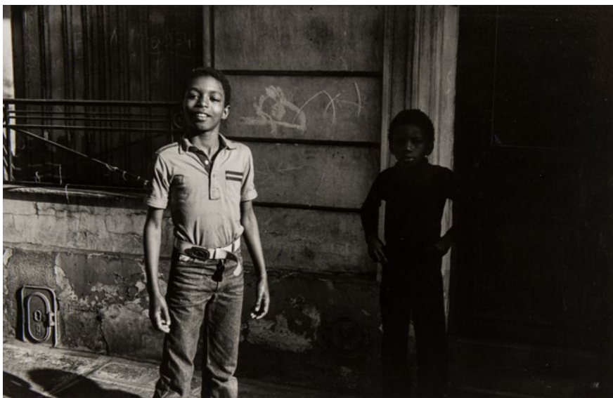
Gabriel Cualladó. Niños jugando , París, 1982 Xiquets jugant. Fotografia a les sals de plata sobre paper, còpia de 1982 17,3 x 26,8 cm IVAM Institut Valencià d'Art Modern, Generalitat. Donació de l'artista