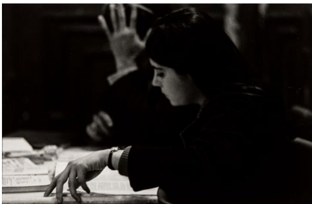
Gabriel Cualladó. Cervecería Alemana , Madrid, 1960 Cerveceria Alemana. Fotografia a les sals de plata sobre paper. Còpia moderna anterior a 1989 17,2 x 26,6 cm IVAM Institut Valencià d'Art Modern, Generalitat. Donació de l'artista