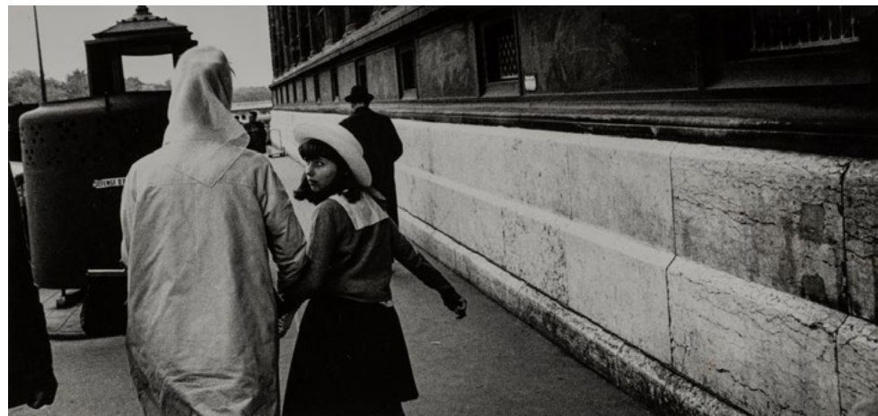
Gabriel Cualladó. París , 1962 Fotografia a les sals de plata sobre paper, còpia de 1982 13,9 x 29,8 cm IVAM Institut Valencià d'Art Modern, Generalitat Donació de l'artista