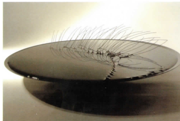
EVELYN HELLENSCHMIDT. Desierto líquido , 2006 Acero al carbono lacado y fundición de bronce, 1,5 x 3 m

nible. “El agua es vida, es una materia prima principal, es energía, es un camino de unión entre pueblos y regiones, es germen de civilización y fuente de cultura –se dice en las primeras páginas que empieza a inspirar aquel encuentro–. Es ante todo un símbolo, símbolo de una gran multitud de cosas, necesarias y universales. La preocupación por el agua es un tema recurrente en numerosas instituciones”.