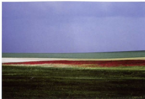
Basilicata, Italia, 1978

la emoción y magia de toda situación, transformando su trabajo en una búsqueda de lo invisible, de ese momento irreplicable que tiene toda obra de arte.