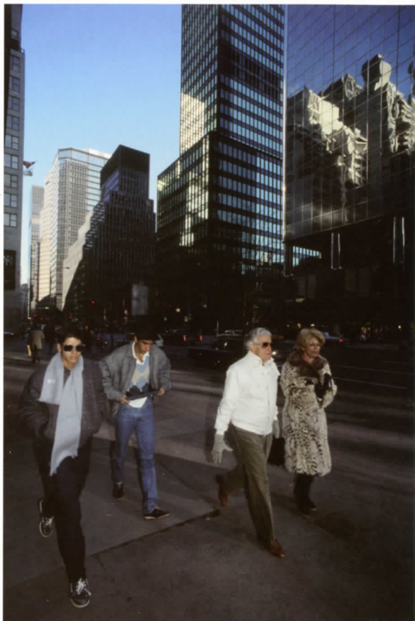
Nueva York, 1986

la emoción y magia de toda situación, transformando su trabajo en una búsqueda de lo invisible, de ese momento irreplicable que tiene toda obra de arte.