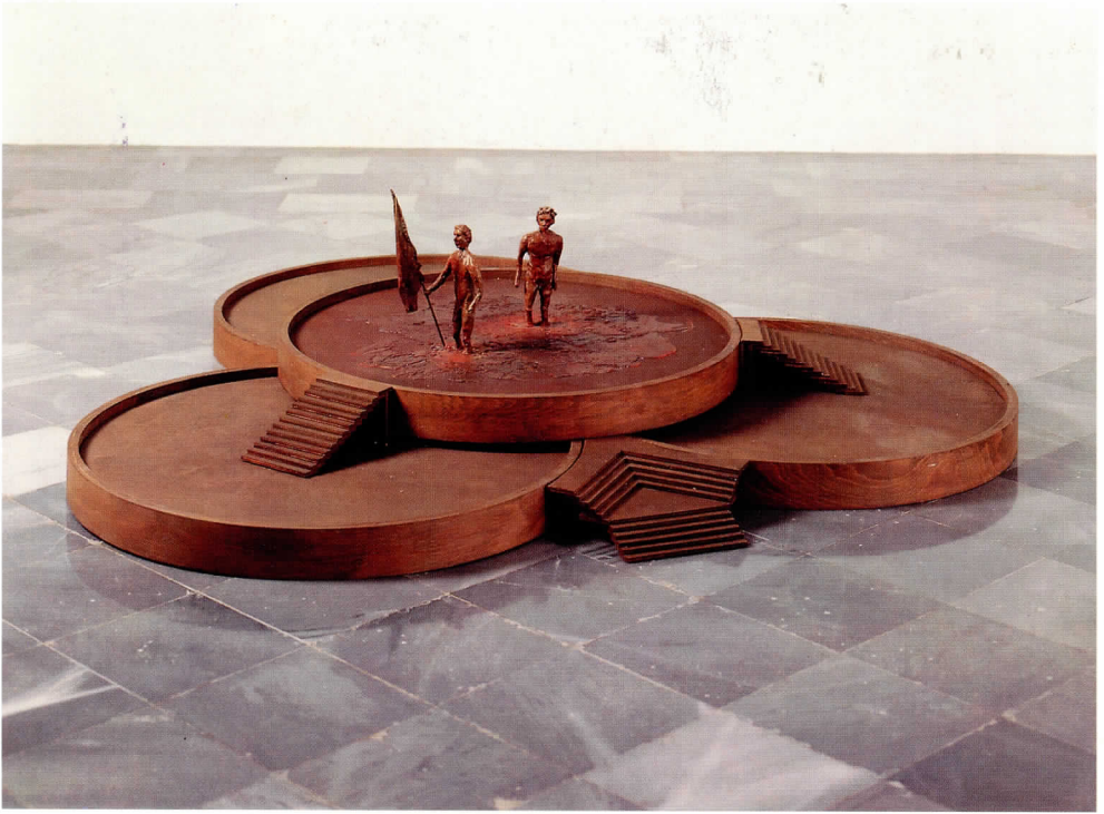
Thomas Schütte, Zwei Männer im Matsch , 1985

El concepto de esta exposición queda determinado por las obras de arte. Su existencia constituye su base y es lo que la hace viable.