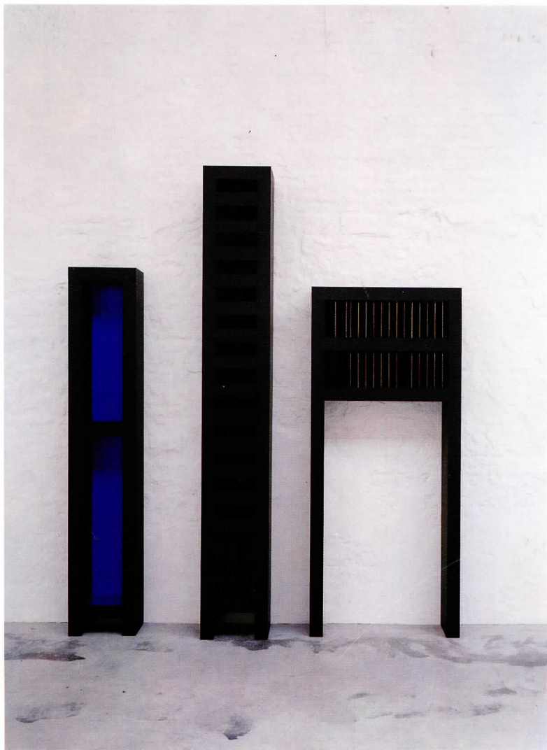
Jan Verduyck, Tombeaux , 1988, 1989, 1990