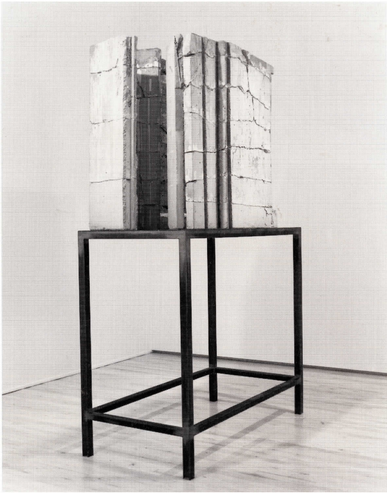
Isa Genzken, Bild , 1989