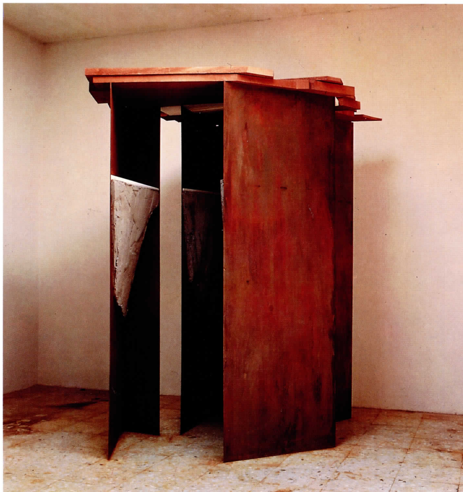
Cristina Iglesias, sin título, 1988