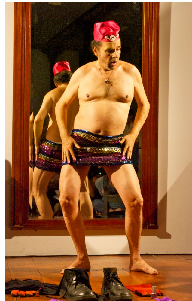
Miguel Benlloch. 56 géneros , 2010.

Las acciones, textos, la actividad política y estética —que Benlloch realiza al calor de lo colectivo y de la vitalidad de los grupos sociopolíticos y artísticos con los que se relaciona— se van conformando como un espacio singular para leer y entender el desarrollo del arte y el activismo en el Estado español de cambio de siglo, que ha puesto en el centro de los discursos el debate y cuestionamiento de las categorías binarias y heterocentadas. Su hacer representa una temprana mirada crítica a la identidad, un pensamiento desde el cuerpo y una escritura que aparece en forma de acción, fotografía, libro, pregón, discurso o pancarta.