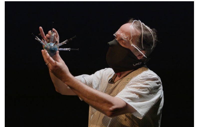
Miguel Benloch. DERERUMNATURA. Quien canta su mal espanta , 2016.