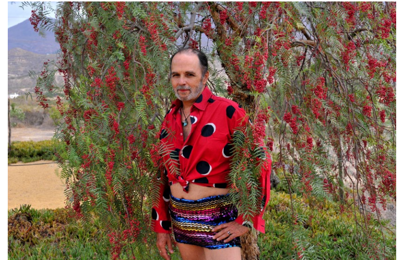
Miguel Benloch. Tipopotropos_serie . Falsa pimienta , 2015. Falsa pimienta , 2015. The Ryder