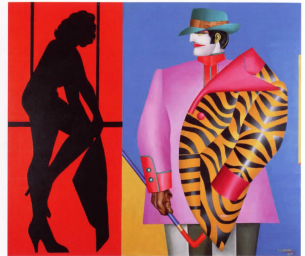
RICHARD LINDNER Rear Window , 1971

La col·lecció de l'IVAM se centra en la contribució europea al pop, i inclou