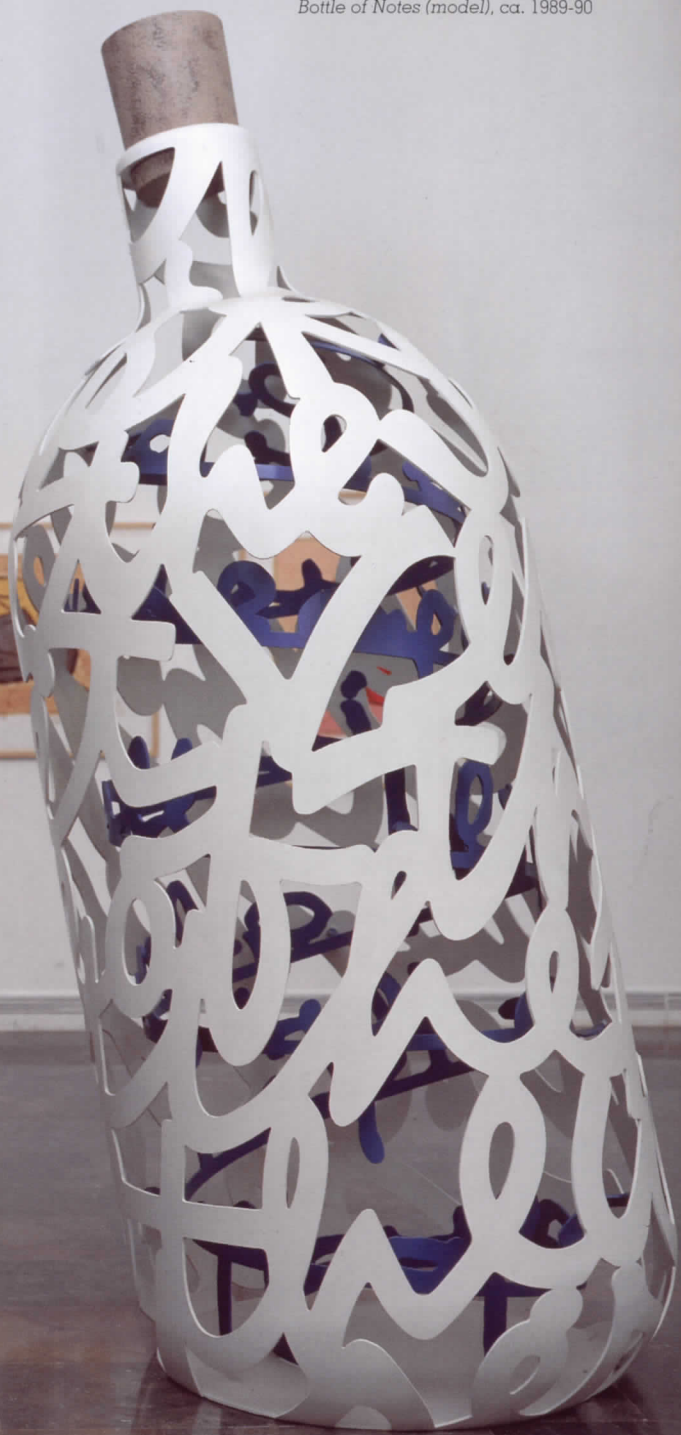
CLAES OLDENBURG & COOSJE VAN BRUGGEN Bottle of Notes (model), ca. 1989-90