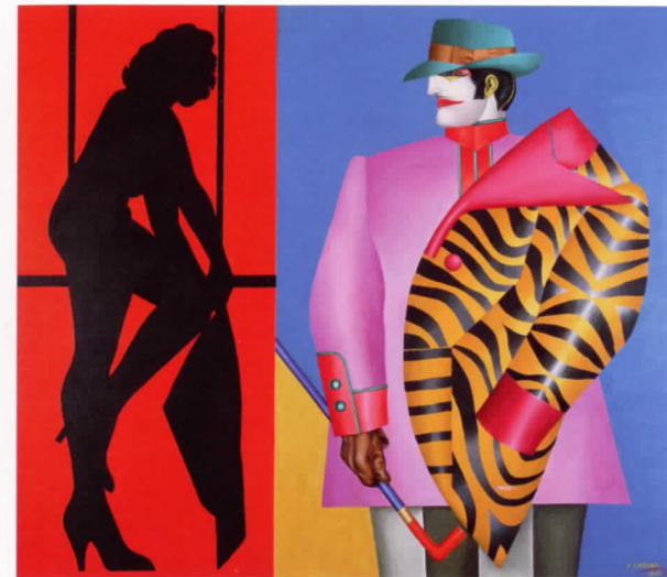
RICHARD LINDNER Rear Window , 1971

La col·lecció de l'IVAM se centra en la contribució europea al pop, i inclou