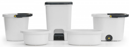
BOB, conjunt d'elements de neteja dissenyat per Inma Bermúdez per a SP.BERNER.

ens interessava a l'hora de seleccionar les peces, és el valor que hi aporten, el testimoniatge que donen d'aquesta complexitat d'un món global que ha col·locat els objectes en el centre de la seua dinàmica social i individual.