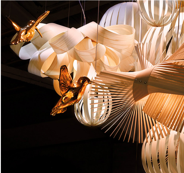
Llum Canelobre, dissenyada per Mariví Calvo per a LZF Lamps.