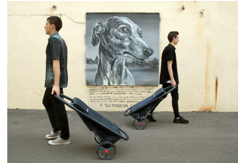
SOFT 8, carret de la compra dissenyat per l'oficina de disseny de ROLSER.

El disseny ocupa hui un lloc en la cultura que antany va estar reservat només per a l'art: educar la sensibilitat del públic. En aquest sentit, la importància del disseny no radica només en el valor econòmic que promou, ni en el testimoni que ofereix de les condicions de producció i circulació, sinó que la importància que té consisteix, sobretot, en la funció d'encarnar valor, valor cultural, en ser el territori en el qual la dinàmica plural i canviant de la