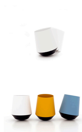
BIEL, papelería diseñada por Ximo Roca para MADE DESING BARCELONA.

El hecho de que la exposición sea en la sede del IVAM en Alcoi permite rendir un homenaje a esta ciudad, que fue uno de los focos de la revolución industrial en España a finales del siglo XIX, así como a las comarcas del interior alicantino, que han mantenido viva hasta hoy una gran tradición de empresas productivas e innovadoras con un fuerte espíritu exportador en un mundo global y que han hecho del diseño un instrumento fundamental de su éxito.