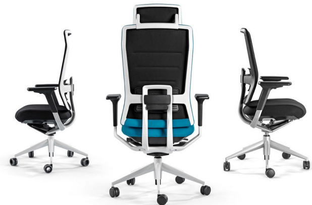
TNK FLEX, silla de oficina diseñada por Marcelo Alegre para ACTIU.

Hay una parte del espacio público que se puede entender como una extensión del hábitat en el sentido de que la hospitalidad, la comodidad o el confort son valores en los que se reconoce. Son espacios interiores que llevan la identidad de quien los promueve pero que buscan generar en quien los visita o los usa la sensación de pertenencia, la sensación de un nosotros, son