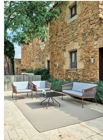
Colección WEAVE, diseñada por Vicent Martínez para POINT.

producto: el territorio de lo particular y lo privado, el territorio de objetos para la espera, la atención o el trabajo, y, por último, el territorio de objetos para estar en el espacio público. Pero todos tienen en común que abren nuevas vías para el diseño de producto.