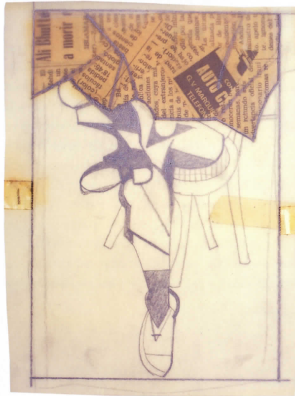
Sin título, 1978

El visitante está invitado a un recorrido iniciático que debería hacer de él el espectador ideal al que aspiraba Equipo Crónica.