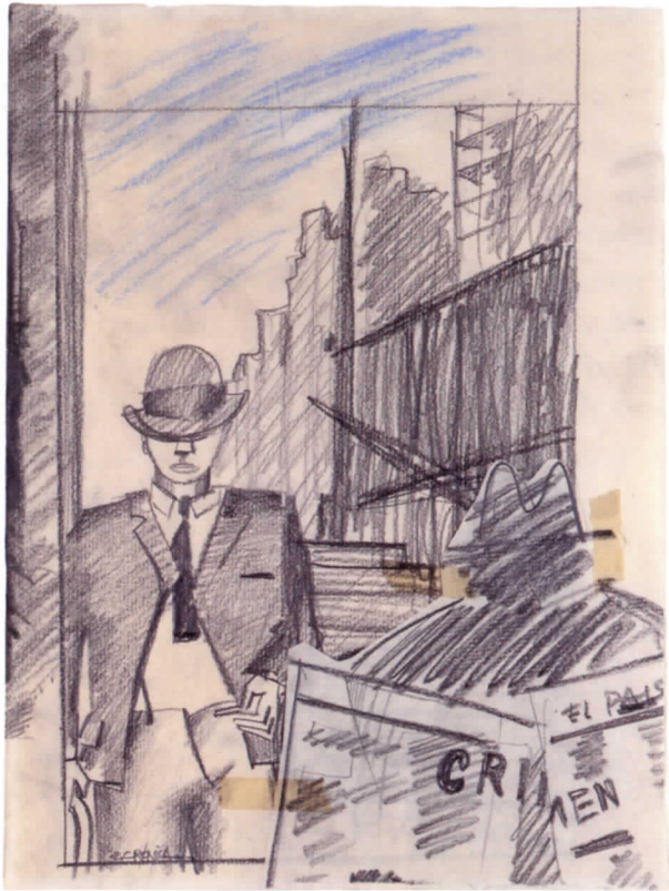
Sin título, 1978

personaje para dejarlo salir de la escena. A veces, el deseo de precisión de la composición o de la línea -a tinta o a lápiz- cede el puesto a una pincelada de acuarela o a un refinamiento obtenido gracias a un sutil equilibrio de lápiz, de gouache y de tinta. Poco a poco adquieren una mayor facilidad y soltura, ganan en espontaneidad, se liberan de su rol preparatorio y se afirman hasta adoptar una técnica habitualmente reservada al cuadro.