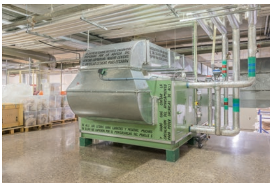
LUCE, Brújula de Actos , 2024