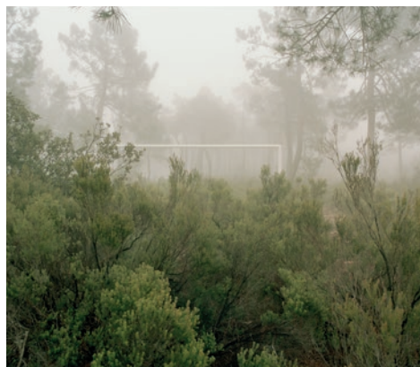
Bleda y Rosa, Res communis IV , 2022

Aquestes peces són el registre fotogràfic i escultòric de la intervenció artística que va romandre instal·lada entre el 6 d'abril i 12 de maig de 2022 en els termes de Pavies i Torralba. L'acció, consistent en la instal·lació de dues porteries situades en terreny forestal i orientades una cap a l'altra, distants