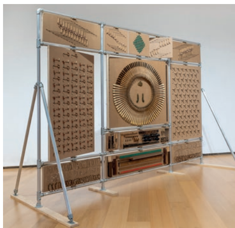
Pep Vidal, El piano de Schrödinger , 2024. Disseny i muntatge a càrrec d' Oriol Pinell

El piano de Schrödinger és una dissecció i descripció detallada de totes les peces d'un piano molt antic. S'han llevat una a una i s'han situat en una sèrie de panells que per una cara funcionen com a elements per a aguantar les peces i per l'altra les descriuen. D'aquesta manera es poden observar alhora des d'un punt de vista físic i un altre teòric; una dualitat sobre l'observació de la complexitat del sistema, com la del propi territori on vivim, en el qual, igual que amb el piano, exercim constantment una metodologia d'anàlisi i control.