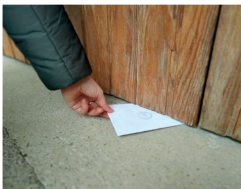
Fent Estudi, Corresponem-nos , 2024

La instal·lació és el resultat de l'activació de les postals generades en Mirades d'Herbers . Cadascuna de les postals està escrita per alguna veïna o veí i ens mostra la seua seua vivència quotidiana al poble. Les postals han sigut enviades des del lloc de residència de cada persona i ens ha ajudat a traçar el