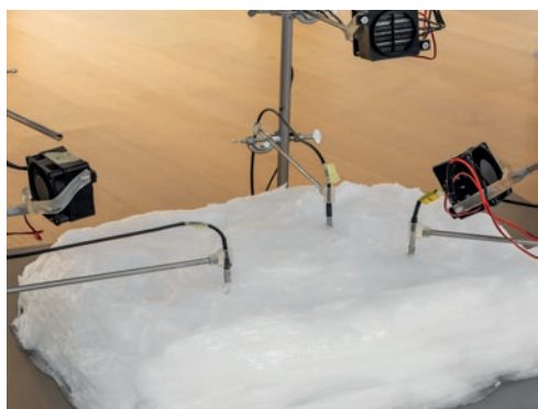
La Cuarta Piel, Cambio de fase , 2024

La peça consisteix en un bloc de greix que aconsegueix, cada dia, la seua temperatura de fusió (~36°C) per a després tornar a l'estat sòlid que asseguren els 22 graus constants del museu. Durant 129 dies d'exposició, el greix modifica el seu estat i aspecte, donant escala a aquest lapse de temps. La peça continua amb la línia d'investigació que La Cuarta Piel va iniciar a Palanques, el campanar de la qual dona les hores a destemps, a causa de les variacions tèrmiques que afecten l'engranatge de l'antic rellotge.