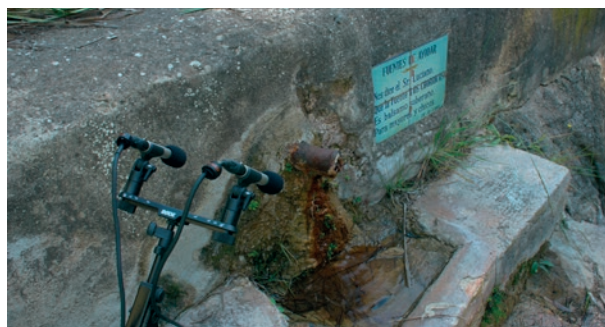
Carlos Izquierdo, Cauce aural , intervenció a Fuentes de Ayódar, 2022

ha dut a terme a la ciutat de València en els últims anys. Al costat de les fotografies, s'exhibeix una màquina en desús que l'artista va trobar en els llocs més recòndits del museu i que decideix introduir a la sala. El text que apareix ací funciona com una «cartel·la expandida» on el visitant recorre l'objecte per a completar la lectura.