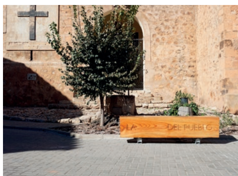
Makea Tu Vida, La ..... del pueblo , intervención en La Puebla de San Miguel, 2022

La pieza es un banco de madera móvil con la inscripción «LA GENT» grabada. Se trata de una pieza que aprovecha el resto de la viga original de madera de pino rojo recuperada y utilizada para las intervenciones en Sacañet (Castelló) y Puebla de San Miguel (Valencia). LA GENT es la pieza que