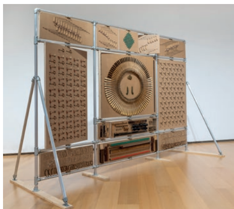
Pep Vidal, El piano de Schrödinger , 2024. Diseño y montaje a cargo de Oriol Pinell

El piano de Schrödinger es una disección y descripción pormenorizada de todas las piezas de un piano muy antiguo. Se han quitado una a una y se han situado en una serie de paneles que por una cara funcionan como elementos para aguantar las piezas y por la otra las describen. De esta manera se pueden observar a la vez desde un punto de vista físico y otro teórico; una dualidad sobre la observación de la complejidad del sistema, como la del propio territorio donde vivimos, en el que, al igual que con el piano, ejercemos constantemente una metodología de análisis y control.