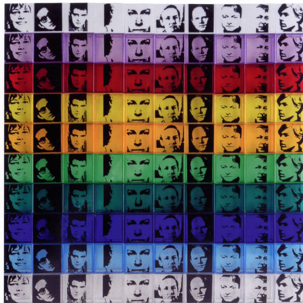
ANDY WARHOL Portrait of the artists, de Ten from Leo Castelli , 1967