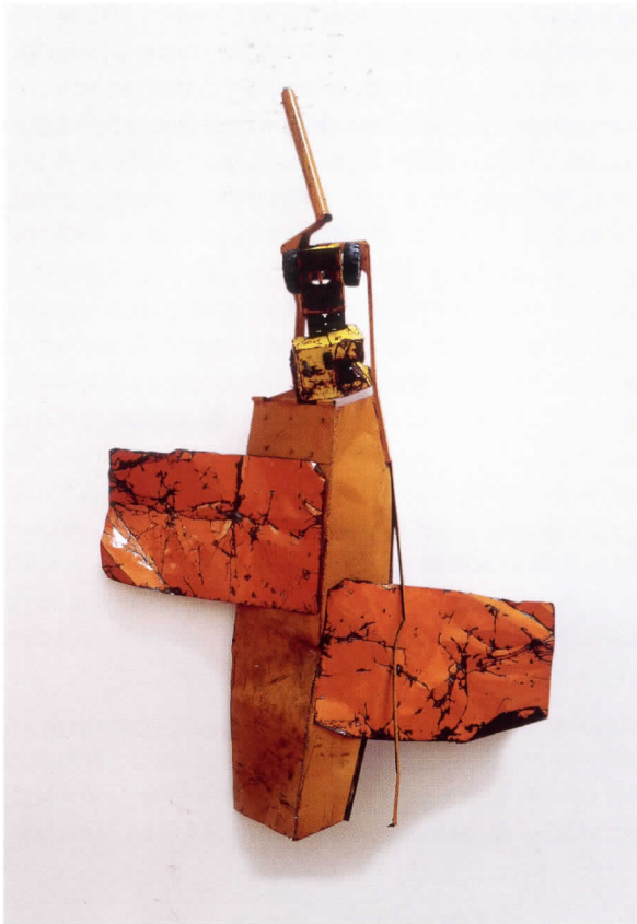
ROBERT RAUSCHENBERG Blood Orange Summer Glut , 1987