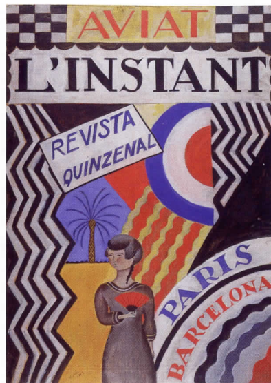
JOAN MIRÓ Aviat l'Instant , 1919

tástrofe que fue la Guerra civil española y la Segunda Guerra mundial. Ahí están los documentos de un final de viaje que desde los materiales del agit-prop rusa, los trabajos de George Grosz o los fotomontajes de John Heartfield o Josep Renau junto a la alegoría de Jacques Lipchitz, Prometheus Strangling the Vulture , expresan el sentido de esta tragedia.