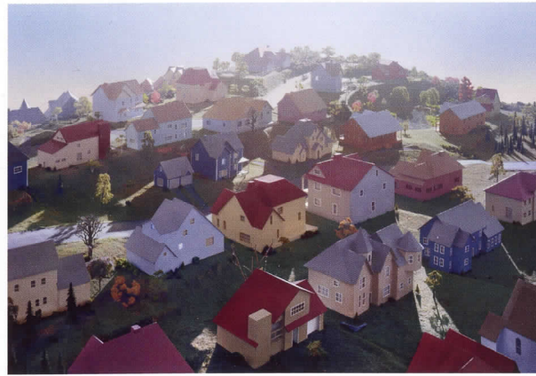
James Casebere. Landscape with houses 1 , 2009