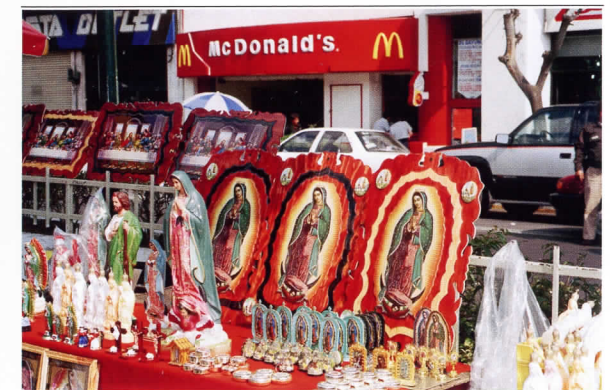
Martin Parr. Religious clocks & McDonald's , 2006