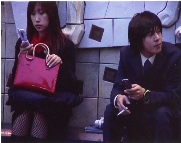
HC Gilje. Night for day , 2004

Esta exposición, a pesar de su carácter completamente autónomo, no podría comprenderse bien sin tener en cuenta la íntima relación que mantiene con la exposición de Malas calles (IVAM, febrero-mayo 2010) o el libro Otras ciudades posibles (IVAM, mayo 2012). Estas tres manifestaciones conforman un conjunto estrechamente relacionado que da una visión amplia y plural sobre el fenómeno urbano de este siglo XXI.