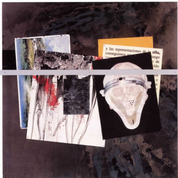
Vanitas (Levántate y anda). Serie Sueños Construidos. 2001. Óleo, collage de elementos diversos y barra de aluminio sobre lona, 200 x 200 cm. Colección Arena, Madrid

A lo largo de la última década las pinturas de José Manuel Ciria se han movido entre la abstracción y la figuración, sus trazos abarcan desde el gesto enérgico hasta el rigor preciso de la cuadrícula. Los cambios sustanciales tanto en su estilo como en su temática han ido paralelos al desplazamiento geográfico del estudio y residencia del artista de Madrid a Nueva York en 2005. Impactante, intensa y en constante evolución, la pintura de Ciria revela un artista que responde a su entorno usando un lenguaje pictórico basado en la emoción pura. Aunque sus propuestas pictóricas varíen, siempre emerge la singularidad en su enfoque que se pone de manifiesto en el comentario de Ciria que afirma que "siempre estamos haciendo la misma pintura". A través de una cuidada selección de más de cien obras, esta muestra destaca las estrategias aparentemente paradójicas utilizadas por el artista que, vistas en su conjunto, transmiten un mensaje claro y potente.