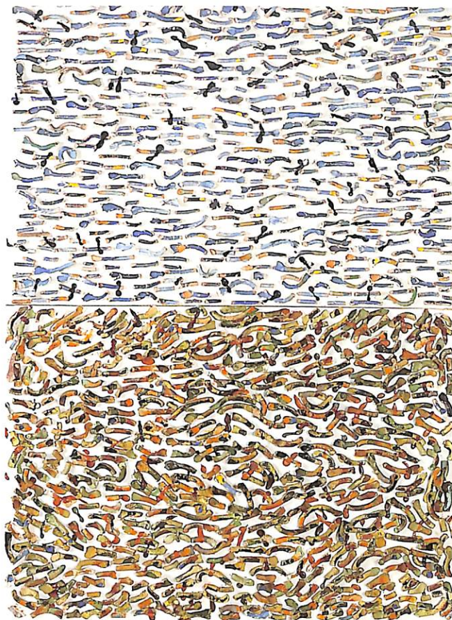
Reconstrucción paisaje, 1978.

rint les idees de procés i permutació més que les de l'estatisme intemporal.