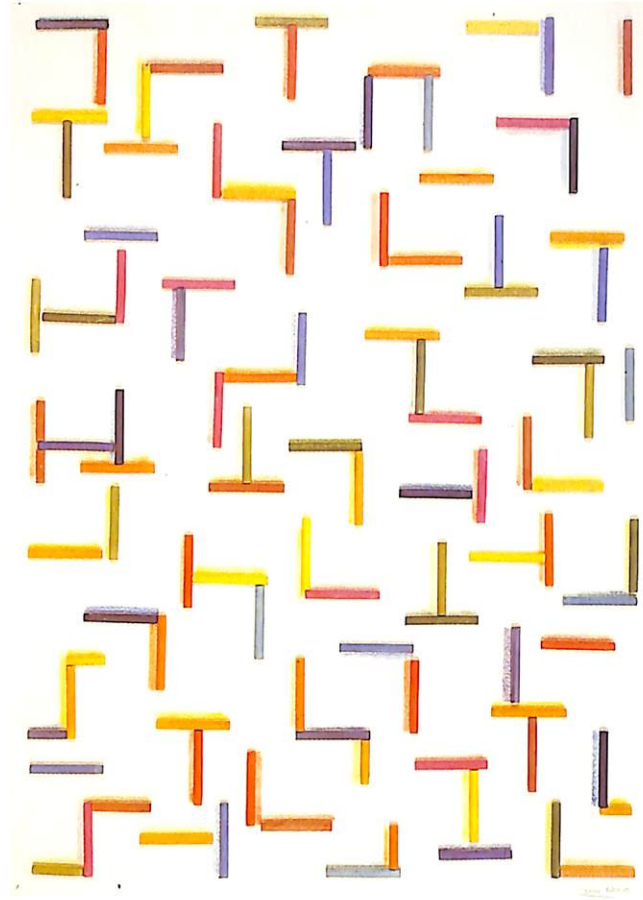
Serie escrituras, 1982.

Del text de Barbara Rose "D'allò íntim a allò monumental".