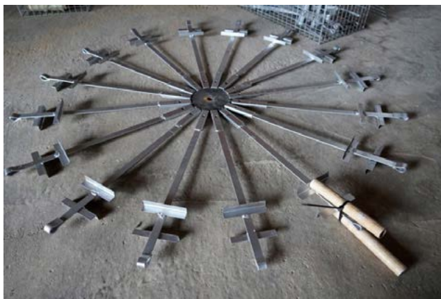
Castell de Pals, Pirotècnia Nadal-Martí de l'Olleria.

A causa de la situació d'excepció sanitària, totes aquestes activitats tenen aforament limitat i requeriran d'inscripció prèvia. Les reserves s'hauran de realitzar en: ivam@consultaentradas.com o tel: 976004973 (de dilluns a dissabte de 9 a 20h).