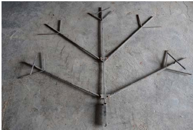
Castell de Pals, Pirotècnia Nadal-Martí de l'Olleria.