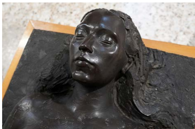
Democràcia , José Azpeitia

planxes de zinc. Les imatges mostren disparaes, mascletades, cordaes, santantonàs, etc., gravacions realitzades entre els anys cinquanta i els anys setanta; un temps encara no digitalitzat, imatges analògiques que al seu torn mostren un foc primitiu, fet per pirotècnies de tècniques antigues. L'artista ha editat aquestes imatges a manera de partitura atonal, provocant un ritme de fogueres i trets que les planxes de zinc tornaran a activar.