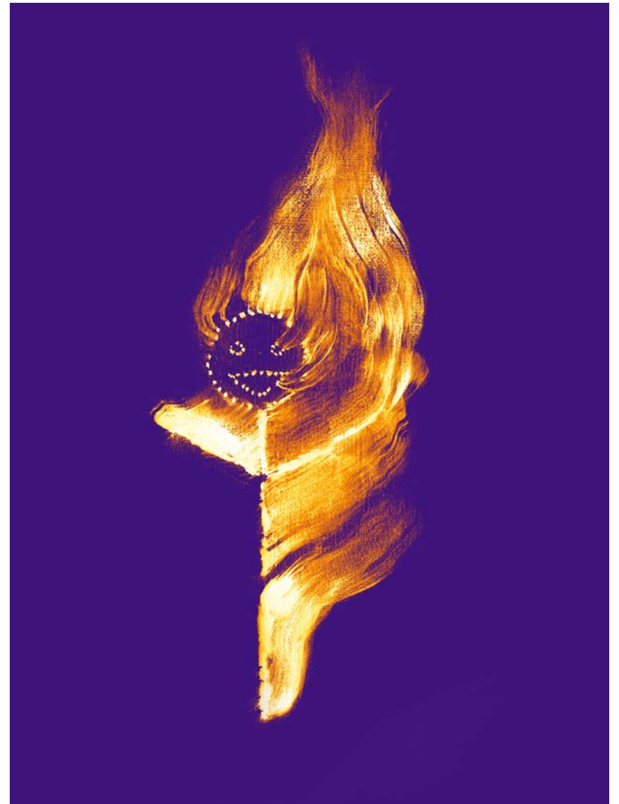
Cardiograma . Pintura de Lola Lasurt adaptada per Ausiàs Pérez, 2021.

El títol de l'exposició, Cardiograma , remet a la idea de diagnòstic de l'estat de sistema personificat en aquesta escultura atemporal de la "Democràcia", conservada al costat dels "ninots" indultats pel Gremi Faller. Alhora també podem entendre les mateixes festes de les Falles com un exercici de diagnòstic col·lectiu que anualment respon a l'actualitat sociopolítica més immediata, aquest any doblement en suspensió per la pandèmia.