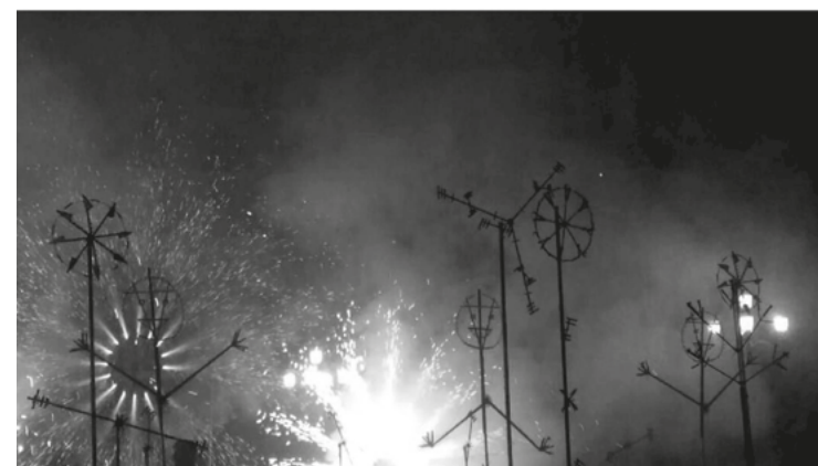
Castell de Pals . Gran Fira de Juliol, València, 2017