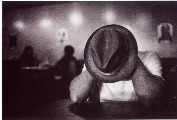
Hollywood Los Ángeles, California, 2007

En esta exposición, el fotógrafo norteamericano Bernie DeChant la ha encontrado. El suyo es