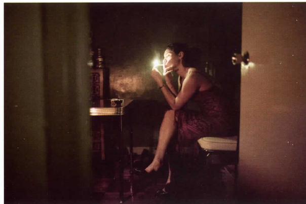
Fuera de horas Hong Kong, 2007

un idilio que va desde la belleza madura de la utopía trasnochada de Brasilia hasta el aislamiento moderno del caos metódico de Tokio. Diseñador gráfico de profesión, el ojo de DeChant parece atrapar sin esfuerzo el flujo orgánico y la geometría sagrada que le inspiran. Al principio de los años cincuenta del siglo pasado, el primer ministro de la India, Nehru, proclamó que la ciudad de Chandigarh quedaría “libre de las tradiciones del pasado”, y que sería “un símbolo de la fe en el futuro de la nación”. Diseñado por Le Corbusier, Chandigarh reflejaría la actitud moderna y progresista de la nueva nación. Poco tiempo después, el presidente de Brasil, Juscelino Kubitschek, hablando de la Brasilia diseñada por Niemeyer, declaró: “Desde esta región montañosa del centro del país, desde este lugar solitario... veo el futuro de mi país”.