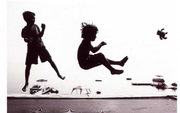
Satélites Lake Almanor, California, EEUU, 2008

un idilio que va desde la belleza madura de la utopía trasnochada de Brasilia hasta el aislamiento moderno del caos metódico de Tokio. Diseñador gráfico de profesión, el ojo de DeChant parece atrapar sin esfuerzo el flujo orgánico y la geometría sagrada que le inspiran. Al principio de los años cincuenta del siglo pasado, el primer ministro de la India, Nehru, proclamó que la ciudad de Chandigarh quedaría “libre de las tradiciones del pasado”, y que sería “un símbolo de la fe en el futuro de la nación”. Diseñado por Le Corbusier, Chandigarh reflejaría la actitud moderna y progresista de la nueva nación. Poco tiempo después, el presidente de Brasil, Juscelino Kubitschek, hablando de la Brasilia diseñada por Niemeyer, declaró: “Desde esta región montañosa del centro del país, desde este lugar solitario... veo el futuro de mi país”.