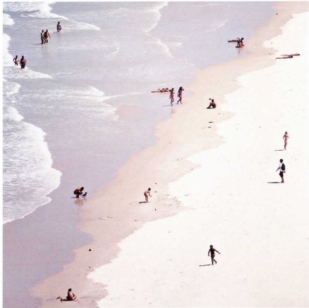
Un día de playa Bahía, Brasil, 2006

La inspiración es el acto de tomar aire, que ejerce una influencia estimulante en nuestro intelecto y nuestras emociones. Es lo que nos permite saber y comunicar la verdad.