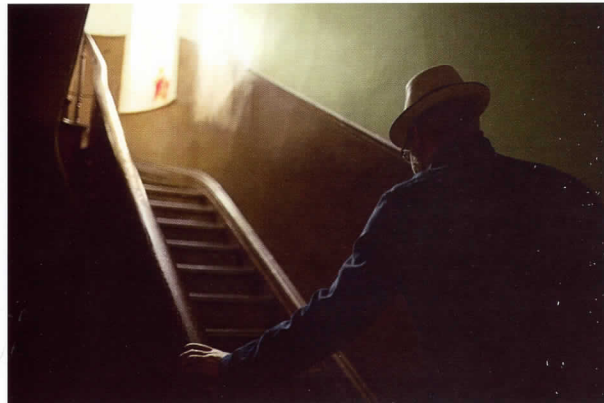
Después del bar Nueva York, 2008