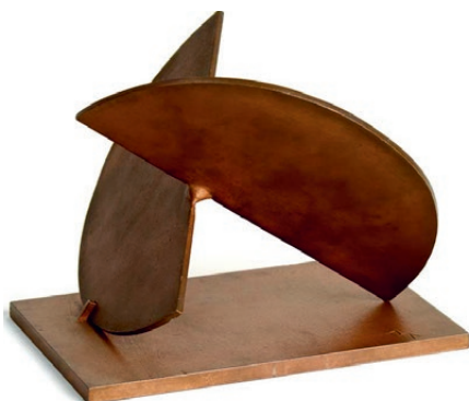
Jorge Oteiza, Par espacial ingràvido / Par mòvil , 1956 (exemplar de 1965-1985)

La dècada dels cinquanta suposarà la progressiva tolerància de l'Estat amb formes i pràctiques artístiques més experimentals. L'abstracció eixirà triomfant d'un debat intens, en l'àmbit artístic, sobre el seu sentit i les seues possibilitats. Paradoxalment, l'art