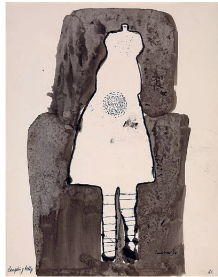
Lucebert, Sense títol (Laughing belly) , 1958

dels materials i de les pràctiques artístiques. S'imposa la sensació que tocava recomençar, que la cosa anterior encarnava un fracàs. Es recorre llavors a l'espontaneïtat o a la irracionalitat, a l'exploració de límits de la raó o del coneixement, a allò purament visual enfront d'allò narratiu, a la llibertat individual, a la subjectivitat, a l'empremta, la ferida o la fractura sobre el llenç o la matèria. Es tracta d'un esforç per desaprendre i començar de nou. L'art, cada vegada més, es pensa a si mateix. L'art fa de l'art el seu propi tema.