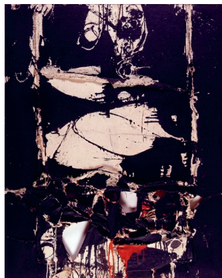
Millares, Cuadro 65 , 1959

sacre es constituí en una de les portes d'obertura cap a formes més contemporànies. L'art d'avantguarda, en paral·lel a la intensificació de les relacions diplomàtiques amb els EUA en el context de la Guerra Freda, va començar a usar-se —igual que allí es va fer— per a promocionar una imatge d'obertura i llibertat.