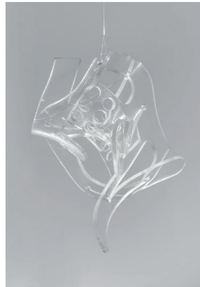
László Moholy - Nagy, Leda and the Swan , 1946

ben llarga. A Espanya, la derrota republicana va suposar l'èxode massiu de grans personalitats de l'art i la cultura. Igual que en els anys vint i trenta, l'art d'avantguarda s'havia nodrit de l'emigració espanyola a París, una emigració forçada, viscuda entre la nostàlgia, l'esperança i l'adaptació, que enriquirà els molts territoris d'acolliment. Així, l'exili espanyol a Mèxic o l'uropeu als EUA seran fonamentals per a la renovació artística.