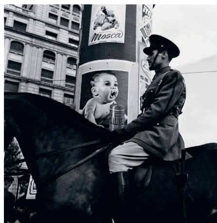
Francesc Català i Roca, Publicitat , de la carpeta Mestres de la fotografia espanyola , 1954

Per al primer franquisme (1939-1959), l'art i la cultura eren una eina important de propaganda. En els anys quaranta, la cultura falangista i el nacionalcatolicisme van proposar oblidar les experiències avantguardistes anteriors i retornar a formes acadèmiques vinculades més a la formació de l'«espíritu nacional» que a la lliure expressió individual. No obstant això,