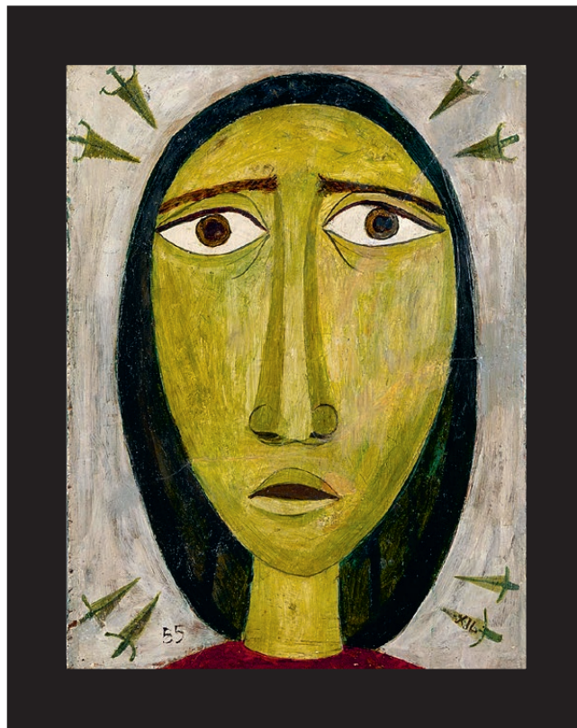
Manolo Gil, La Dolorosa , 1955

Dossier de premsa Institut Valencià d'Art Modern