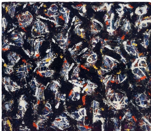
Lee Krasner, Abstract n° 2 , 1946-1948