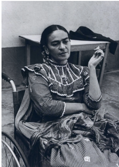
Frida Kablo, Coyoacán, Mèxic D.F., 1940-1946

El triomf del nazisme a Alemanya va produir una greu suspensió de les llibertats, la persecució de totes la formes culturals i artístiques que no foren afins al Tercer Reich, i l'exili forçat de molts creadors i intel·lectuals. En 1939, les tropes alemanyes envaeixen Polònia i, en 1941, Alemanya ja havia ocupat la pràctica totalitat d'Europa. A mesura que avançava l'ocupació nazi, molts artistes mampregueren una fugida