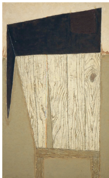
Salvador Soria, Mesa con tapete negro , 1958