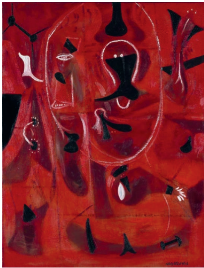
Adolph Gottlieb, Alchemist (Red Portrait) , 1945