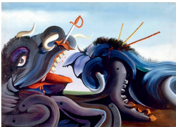
Oscar Domínguez, Le taureau blessé , 1939

ben llarga. A Espanya, la derrota republicana va suposar l'èxode massiu de grans personalitats de l'art i la cultura. Igual que en els anys vint i trenta, l'art d'avantguarda s'havia nodrit de l'emigració espanyola a París, una emigració forçada, viscuda entre la nostàlgia, l'esperança i l'adaptació, que enriquirà els molts territoris d'acolliment. Així, l'exili espanyol a Mèxic o l'uropeu als EUA seran fonamentals per a la renovació artística.