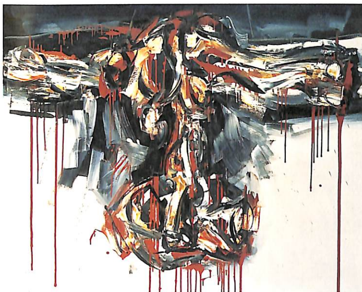
Crucifixion Rouge. 1963

L'exposició que es mostra a l'IVAM, presentada al Musée d'Art et d'Histoire de Ginebra, amb motiu del 50 aniversari de la presentació de les col·leccions d'El Prado, palesa un esguard específic sobre els modes d'expressió del pintor, tots vinculats, però visualment autònoms. Proposa abordar l'obra pictòrica de Saura únicament a través de quatre temes: