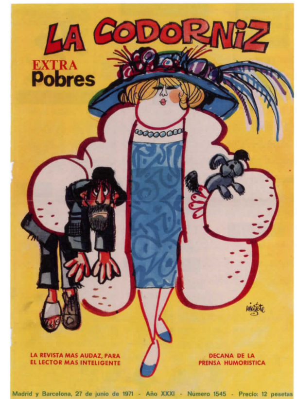
Portada de La Codorniz , 27 de junio de 1971

zante, emparentado con toda la edad dorada del humorismo español, junto a Ramón Gómez de la Serna, a Tono, a Jardiel, a Miguel Mihura; el azote de las severidades morales; el crítico de la injusticia social, el dietarista de la vida cotidiana, el intérprete gráfico de El Quijote destaca, dentro de la unidad absoluta de su universo propio, el vitalismo de su actitud por encima de cualquier otra característica. El humor de Mingote, a pesar de su ironía y acidez medidas, nunca cae en el sarcasmo, la negrura o el nihilismo, produciendo por ello sus viñetas un efecto reconfortante en el lector. Antonio Mingote es un humanista del humor, y aunque su humanismo puede ser trágico a veces, ya que refleja la realidad, el autor siempre nos administra un lenitivo en forma de chiste.