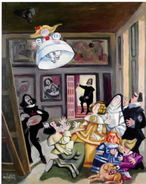
Menina , 1995. Óleo sobre lienzo, 92 x 72 cm

dura en la actualidad. También dirigió por esa época, la revista humorística Don José . Escribió para el teatro, para televisión y guiones de películas como Soltera y madre en la vida , Pierna creciente , falda menguante , Hasta que el matrimonio nos separe , o su sátira política Vota a Gundisalvo . Posteriormente escribió su segunda novela, Adelita en su desván .