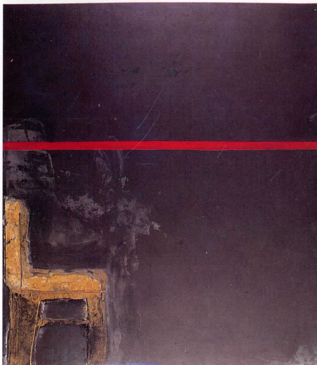
Negre amb línia vermella, 1963

L'exposició, després de la seua inauguració a la Fundació Antoni Tàpies de Barcelona i la seua presentació a l'IVAM de València, viatjarà a la Serpentine Gallery de Londres.