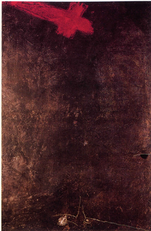
Pintura amb creu vermella, 1954

més incompresos. La Fundació Antoni Tàpies, en coproducció amb l'IVAM de València, presenta l'exposició Comunicació sobre el mur amb l'objectiu de fer una revisió crítica de l'etapa matèrica del pintor català. La mostra recull un conjunt de vuitanta obres que foren realitzades entre els anys 1954 i 1967. A partir d'aquesta data, i sobretot des del 1970, s'evidencia una clara inclinació de les seves obres cap als objectes. Tot i així la noció de pintura matèrica no respon a una categoria cronològica, sinó a una manera de treballar. Per aquesta raó han estat incloses a l'exposició una sèrie