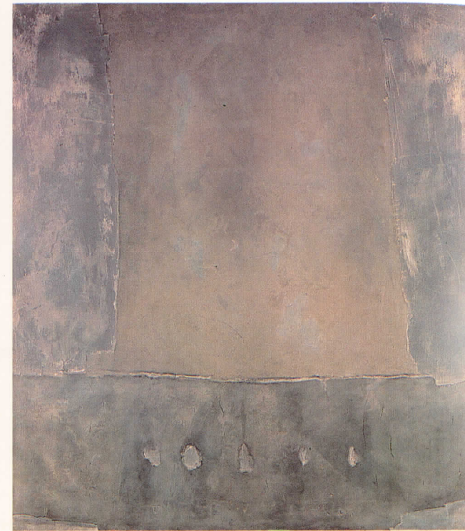
Gris amb cinc perforacions, 1958

més incompresos. La Fundació Antoni Tàpies, en coproducció amb l'IVAM de València, presenta l'exposició Comunicació sobre el mur amb l'objectiu de fer una revisió crítica de l'etapa matèrica del pintor català. La mostra recull un conjunt de vuitanta obres que foren realitzades entre els anys 1954 i 1967. A partir d'aquesta data, i sobretot des del 1970, s'evidencia una clara inclinació de les seves obres cap als objectes. Tot i així la noció de pintura matèrica no respon a una categoria cronològica, sinó a una manera de treballar. Per aquesta raó han estat incloses a l'exposició una sèrie