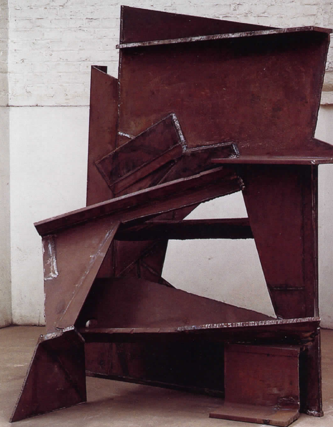
Straight On (Tot recte), 1972