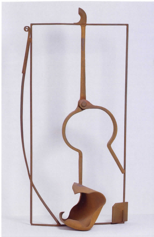
Table Piece 'Catalan Maid' (Table Piece "La criada catalana"), 1987-88