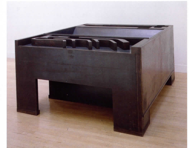
Night and Dreams (Nit i somnis), 1990-91

Caro destaca entre els escultors contemporanis en el seu desafiament a la tradició del "pedestal", ja que utilitza el sòl com a base a fi d'involucrar més íntimament l'espectador en l'espai de l'escultura. Fa també xicotetes escultures-taules, bronzes, i el 1989 realitza unes construccions arquitectòniques que denomina "esculti-