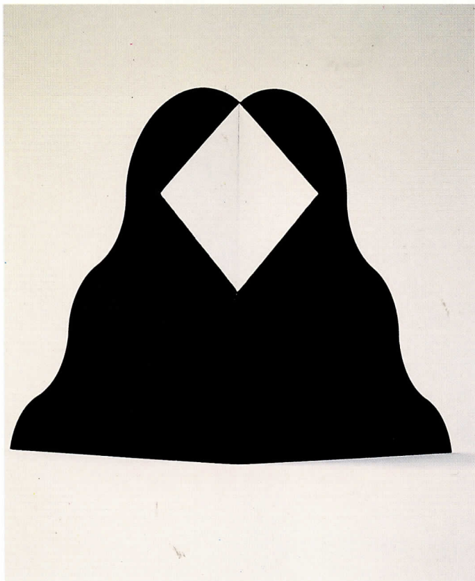
Johann Wolfgang Goethe, 1989