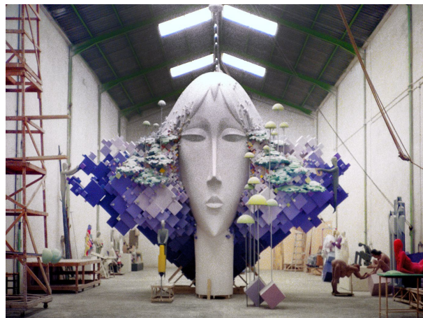
Homo sapiens, sapiens, 1992. Fotografia d'una parte de la Falla Espartero-GV Ramón i Cajal en el taller.

Encara que Alfredo Ruiz va heretar l'estil barroc i grotesc dels seus mentors, prompte va començar a buscar en les falles un mitjà d'expressió de les seues pròpies inquietuds i idees. Així doncs, a partir de 1982 va començar a tractar temàtiques socials com l'ecologisme, la desigualtat, el capitalisme, el racisme, la pena de mort, la vellesa, la llibertat individual o el paper actiu de la dona en societat, entre altres. Unes temàtiques innovadores en un lloc que repetia fórmules ja cremades.