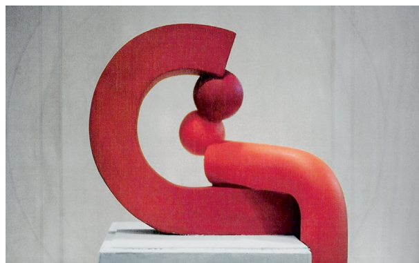
Mua Mua, 2001. Maqueta per a una escena de la Falla Quart-Palomar.

La dictadura ho va sumir en una ignorància artística que va contrarestar amb l'estudi autodidacta de les avantguardes internacionals, trobant-se recurrentment amb el pensament i l'actitud de Nietzsche, Malévich o Dubuffet.