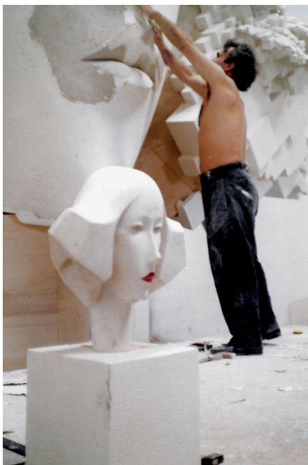
Homo sapiens, sapiens , 1992. Fotografía de Alfredo Ruiz en su taller.

La dictadura lo sumió en una ignorancia artística que contrarrestó con el estudio autodidacta de las vanguardias internacionales, encontrándose recurrentemente con el pensamiento y la actitud de Nietzsche, Malévich o