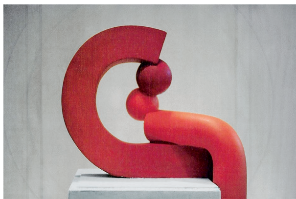
Mua Mua , 2001. Maqueta para una escena de la Falla Quart-Palomar.