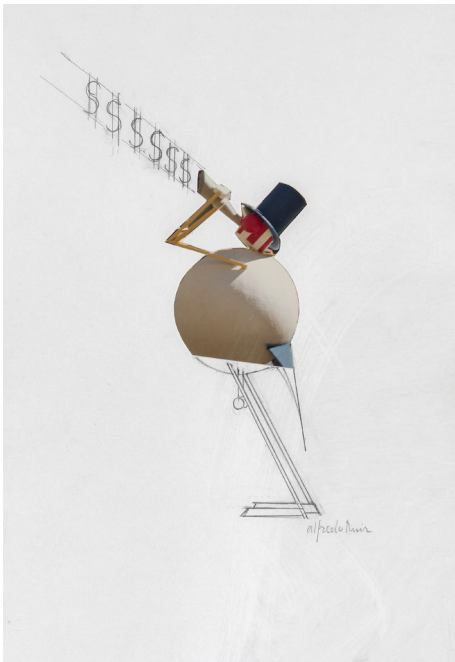
Sin título, s.f.