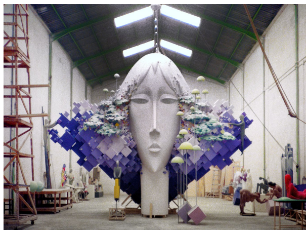
Homo sapiens, sapiens, 1992. Fotografía de una parte de la Falla Espartero-GV Ramón y Cajal en el taller.