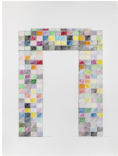
Sin título, 2000.

Dubuffet. Y, aunque gracias a sus fallas trabajó temporalmente en Lladró como diseñador jefe de equipo, siempre regresó a la calle, al espacio público. Aquel lugar le sedujo una y otra vez. Allí, en las fallas, el arte era un regalo que se ofrecía a la ciudad.