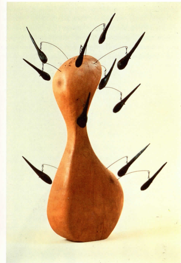
Botella de madera con pelos, 1943

los que se encontraban Jean Arp, Marcel Duchamp, Fernand Léger, Theo Van Doesburg y, los más importantes, Joan Miró y Piet Mondrian —los artistas que tuvieron una influencia más duradera en su carrera.