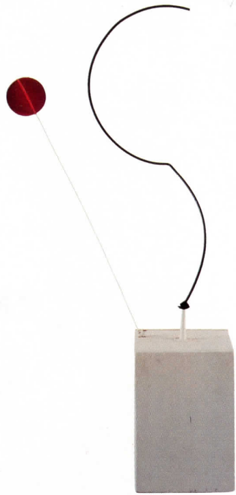
Medio círculo, cuarto de círculo, esfera, 1932

La exposición presenta esculturas realizadas por Calder desde 1926 a 1972, trabajos de joyería fechados entre 1935 y 1940 y obra sobre papel. Las obras proceden, en su mayoría, de la colección permanente de Alexander Calder del Whitney Museum of American Art de Nueva York, que es una de las más completas del artista.