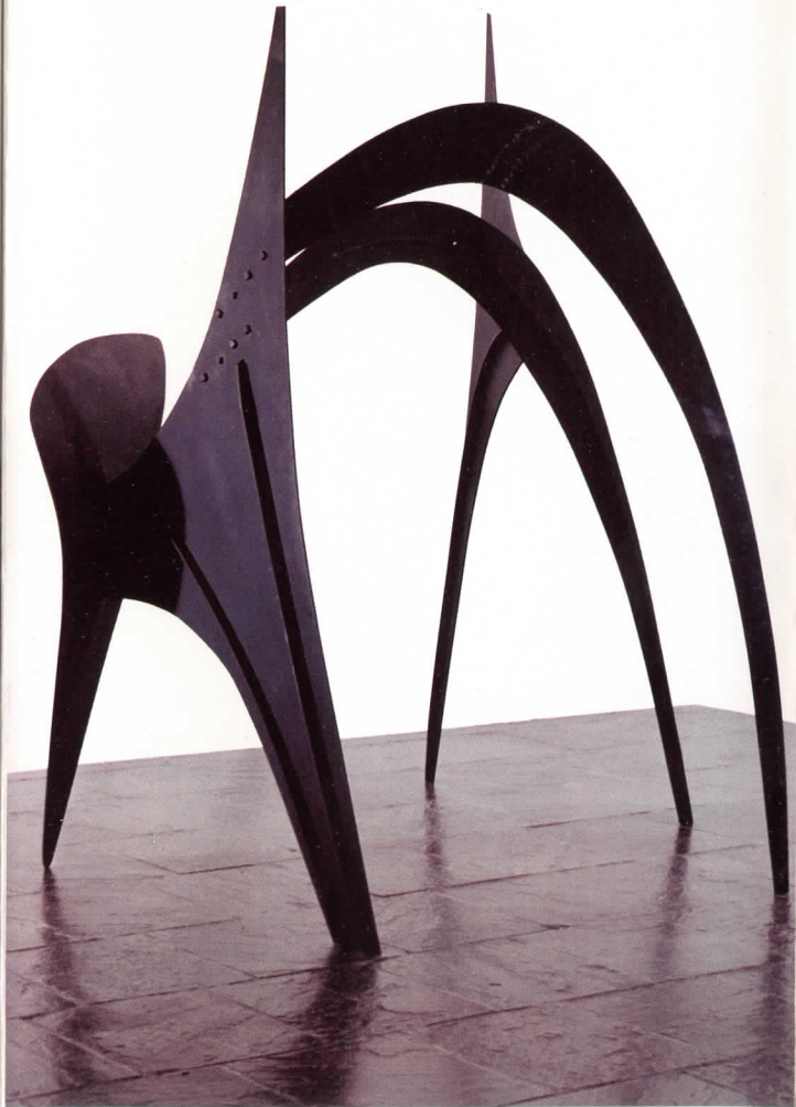
Los arcos, 1959

Esta exposición fue organizada por el Whitney Museum of American Art, Nueva York, con una generosa donación de Annie Laurie Aitkin Charitable Trust.