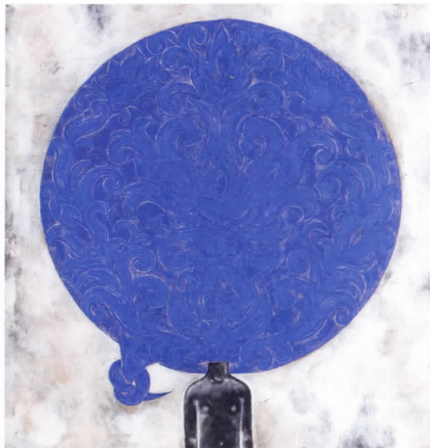
Anibal, 2007 Acrílic sobre paper, 115 x 115 cm. Col·lecció particular

L'exposició After all, tomorrow is another day de l'artista Jorge Pineda, Barahona, República Dominicana, 1961, es planteja com una revisió dels últims deu anys de treball, on s'inclouen escultures, dibuixos i instal·lacions reflex del seu personal imaginari.