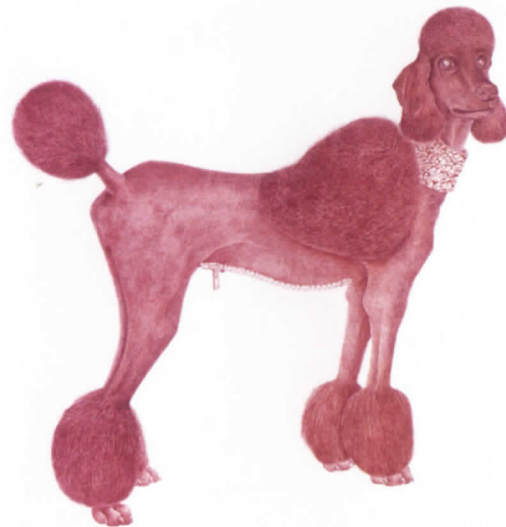
Happy I, 2012 Tinta roja sobre paper Canson, 115 x 115 cm. Col·lecció de l'artista