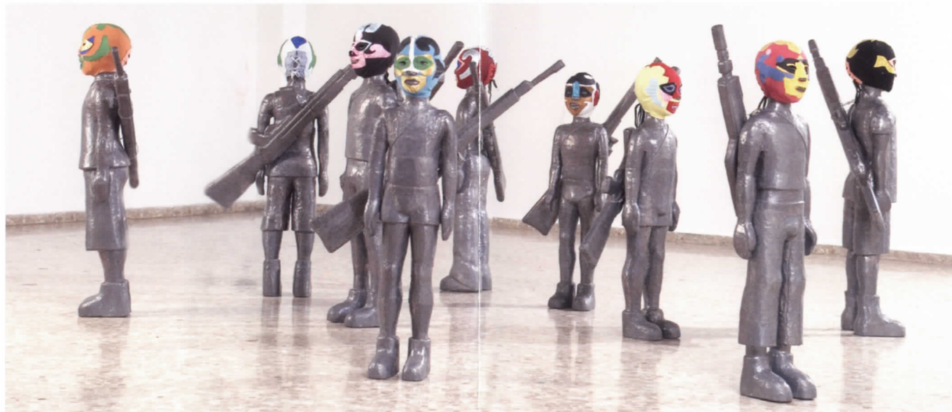
Mambrú, 2006 Fusta de cedre forrada de xapes de plom martellada i màscares de tela 9 x (110 x 30 x 30) cm. Col·lecció de l'artista

Els seus plantejaments conceptuals líric-narratius comporten una suggeridora anàlisi crítica del sistema i de la societat contemporània que situen al ser humà en l'eix del mateix. El resultat d'esta composició provoca uns muntatges turbadors que, a pesar de la inquietud que transmeten, sempre irradien xicotetes dosis de fe i esperança que ajuden a superar el que a priori se'ns mostra com tràgic i caòtic.