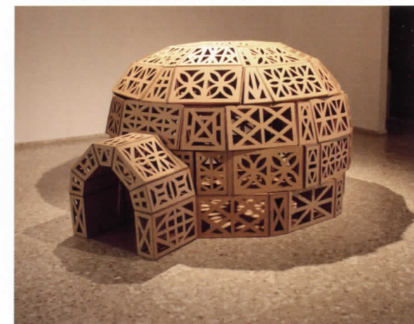
La casa de Mario Merz, 2006 Cartó i metall, 120 cm d'altura x 150 cm de diàmetre. Col·lecció de l'artista