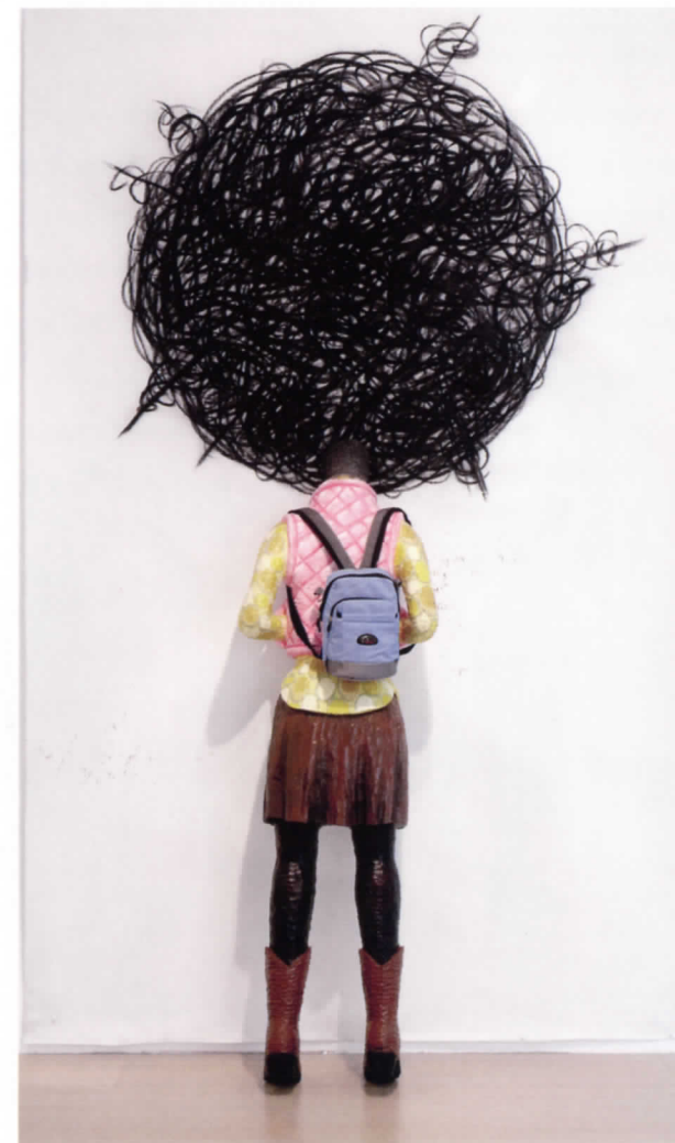
Afo Fashion, 2009. Fusta tallada i policromada, maxilla de tela i carboner, 160 x 50 x 30 cm. IVAM Institut Valencià d'Art Modern, Generalitat