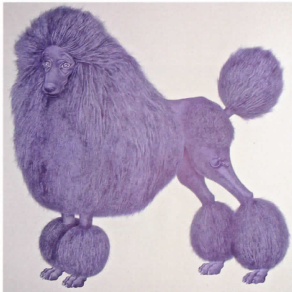
Jappy II, 2012 Tinta blau sobre paper Canson, 115 x 115 cm. Col·lecció de l'artista