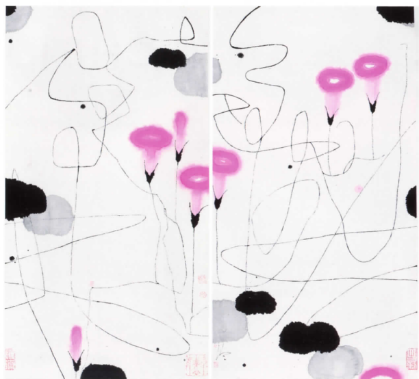
CHEN JIALING Campanilla , 2007. Tinta y papel, 140 x 140 cm

modernidad de la pintura china de la retaguardia a la primera línea. Ha dado a los críticos de arte modernos tantas emociones como desconciertos", dijo una vez un crítico. La innovación de Zhang radica en la rotura de lo tradicional desde la distorsión y la decoración de elementos como la flor, el pájaro, la rama y la hoja a la reconstrucción de un nuevo esquema, en el que simplifica y señala las ideas abstractas de la pintura mediante colores brillantes, varios espacios y tiempos que recuerdan una sinfonía y que dan una sensación de frescura al espectador.