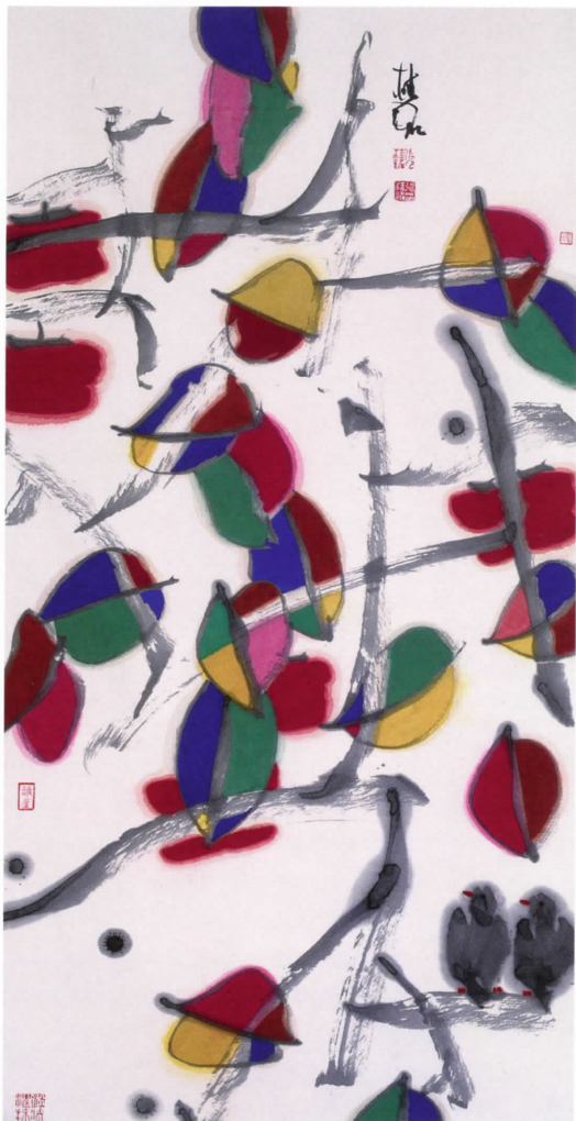
ZHANG GUIMING Otoño gélido , 2006. Tinta y papel, 132 x 68 cm

sus obras, características también del propio artista, representan un ambiente en el que se entremezclan lo antiguo y lo moderno así como la realidad y la ilusión. El lenguaje y las figuras que muestra en sus cuadros son la representación de la añoranza del artista por el estado puro y primario de la humanidad, que es en realidad la expresión espontánea de la educación, la tolerancia y el gusto del artista.