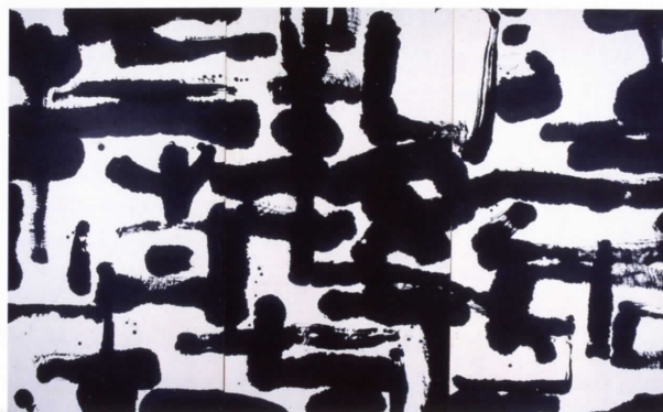
DAI MINGDE Serie Yi-Armonía , 2000. Tinta y papel, 178 x 288 cm

sus obras, características también del propio artista, representan un ambiente en el que se entremezclan lo antiguo y lo moderno así como la realidad y la ilusión. El lenguaje y las figuras que muestra en sus cuadros son la representación de la añoranza del artista por el estado puro y primario de la humanidad, que es en realidad la expresión espontánea de la educación, la tolerancia y el gusto del artista.