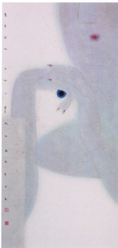
LU FUSHENG La era de los anuncios , 2000. Tinta y papel, 180 x 87 cm

Yang Zhengxin, de carácter generoso y honesto, es un excelente pintor que derrocha una pasión romántica. Es versátil en los campos de flor-y-pájaro, paisaje y retrato con estilos variados y poco convencionales. Los solemnes y místicos cuadros, de pinceladas fuertes e inimaginables, muestran el gran talento y el valor del pintor con su fuerza explosiva insaciable y su deslumbrante variabilidad. A partir de las técnicas occi-