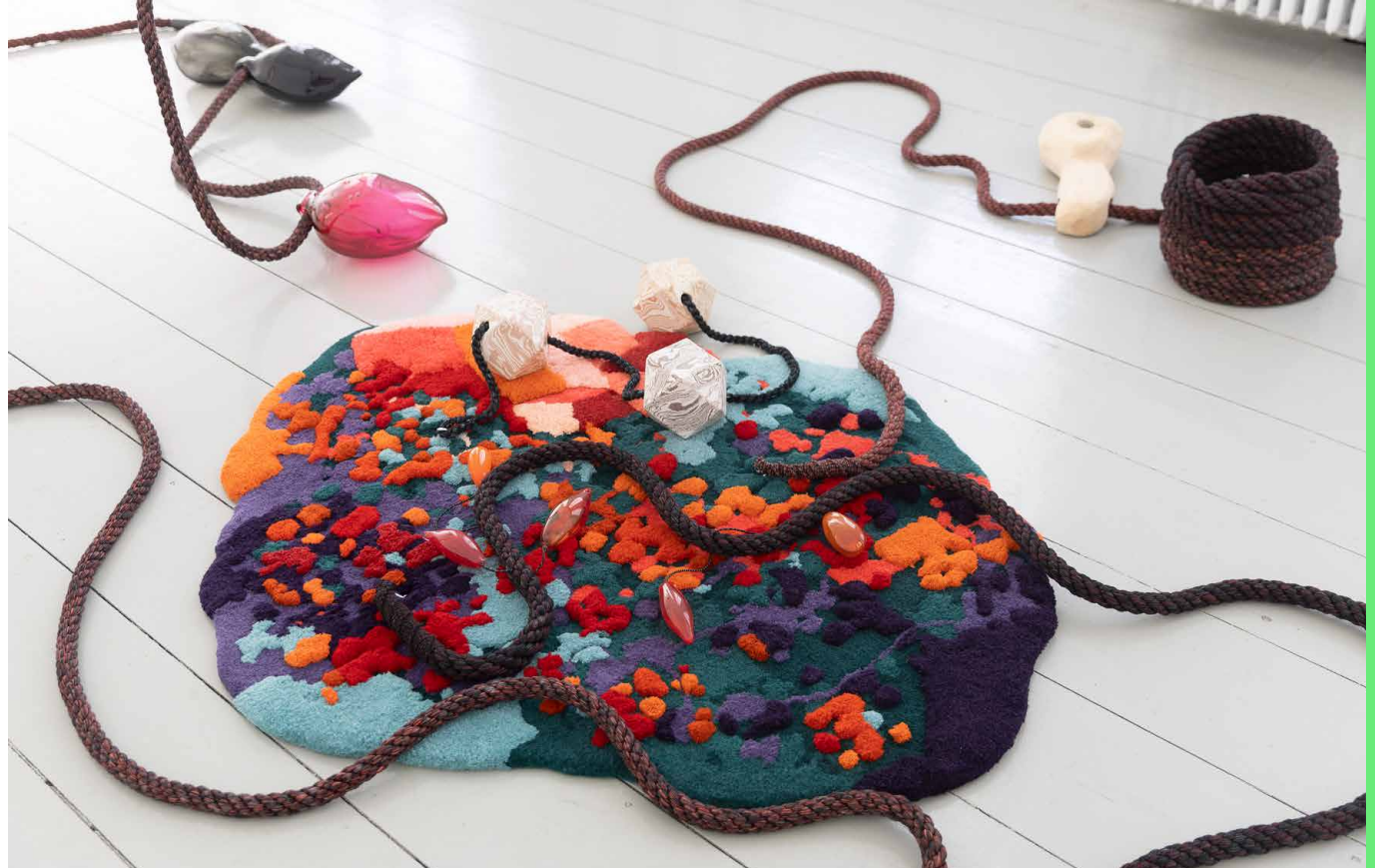
Otobong Nkanga - Loaded tears turned to rock , 2023

Pedres, teles, espècies o plantes són materials que Otobong Nkanga utilitza en les seues instal·lacions, la qual cosa li permet parlar de la terra i de la gent que l'habitarem. A través de dinàmiques d'acció i performance rellegirem en grup algunes de les principals obres de la mostra, la qual cosa servirà de punt de partida per a la creació col·lectiva i el diàleg sobre temes d'actualitat com la migració, les transformacions naturals i humanes, les històries d'apropiació i de pèrdua.