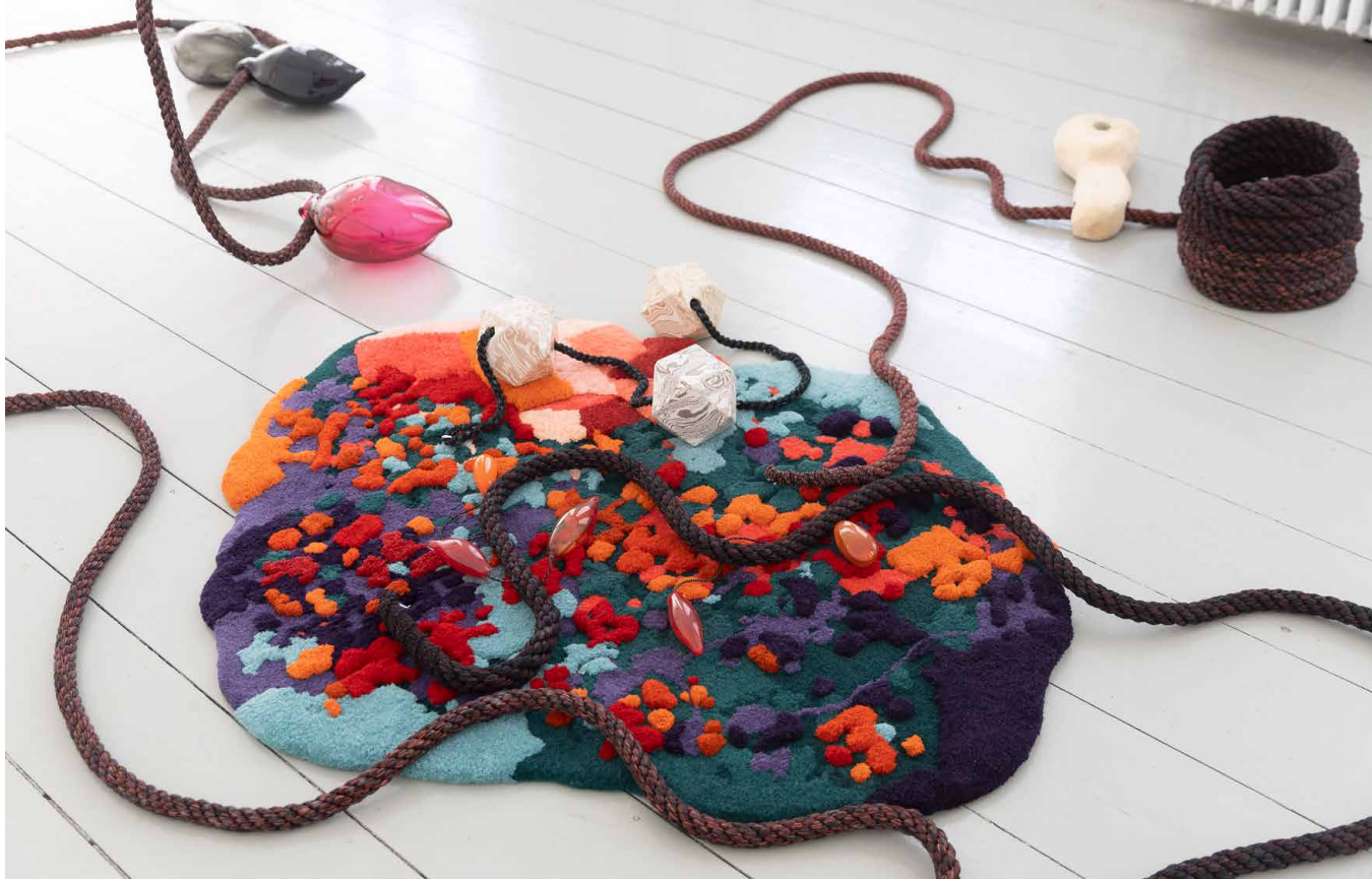
Otobong Nkanga - Loaded tears turned to rock , 2023

Piedras, telas, especies o plantas son materiales que Otobong Nkanga emplea en sus instalaciones, lo que le permite hablar de la tierra y de la gente que la habitamos. A través de dinámicas de acción y performance releeremos en grupo algunas de las principales obras de la muestra, lo que servirá de punto de partida para la creación colectiva y el diálogo sobre temas de actualidad como la migración, las transformaciones naturales y humanas, las historias de apropiación y de pérdida.