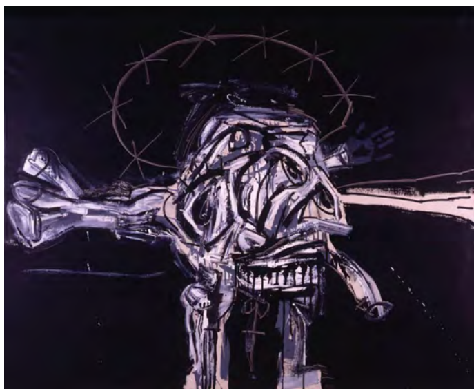
Antonio Saura / Crucifixión , 1959 IVAM Institut Valencià d'Art Modern, Generalitat